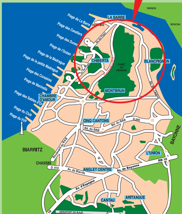
Promenade de La Barre Forêt du Pignada