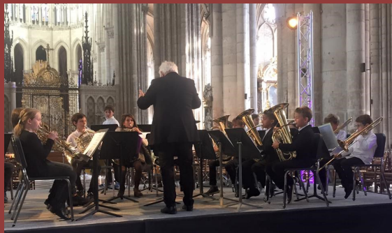
Concert de l'orchestre des cuivres junior du conservatoire à rayonnement régional d'Amiens dans le cadre du Festival des cuivres d'Amiens.

Date à retenir : le samedi 21 janvier à 11h aura lieu la cérémonie des vœux, salle du Chiffon rouge à Flixecourt.