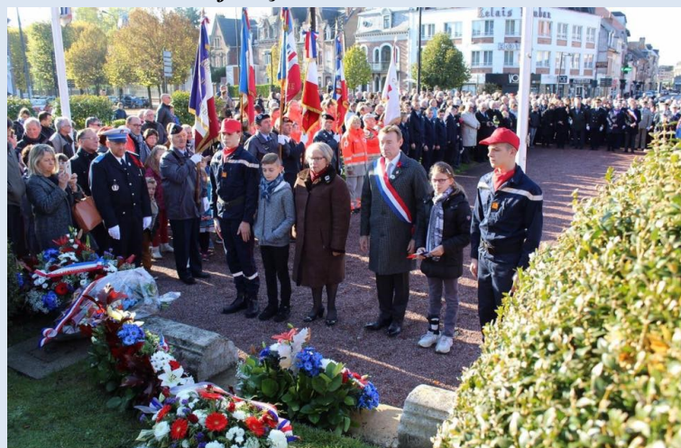
Cérémonie du 11 novembre à Abbeville