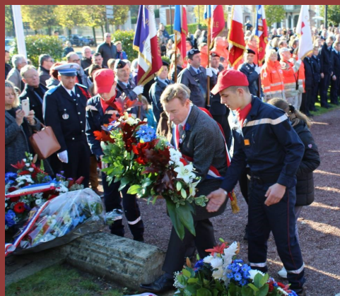
Cérémonie du 11 novembre à Abbeville.