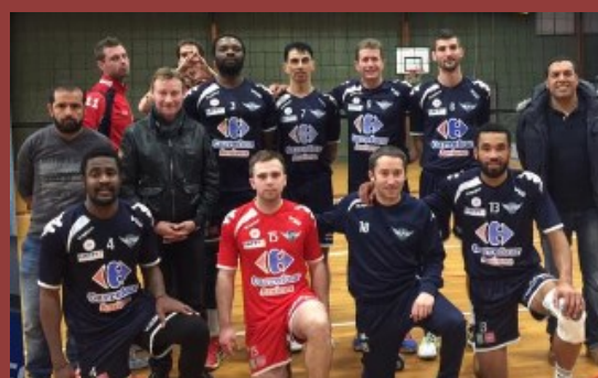
Victoire du Volley club d'Amiens nord en Elite