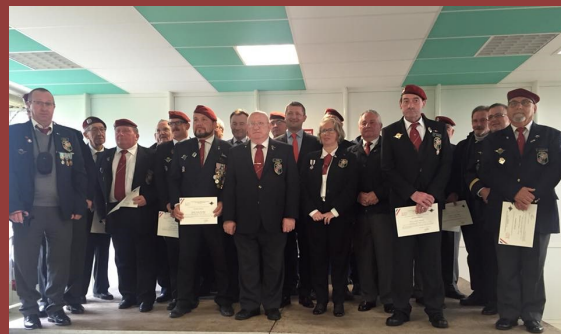
Fête de la Saint Michel. Les parachutistes de la section maritime 801.