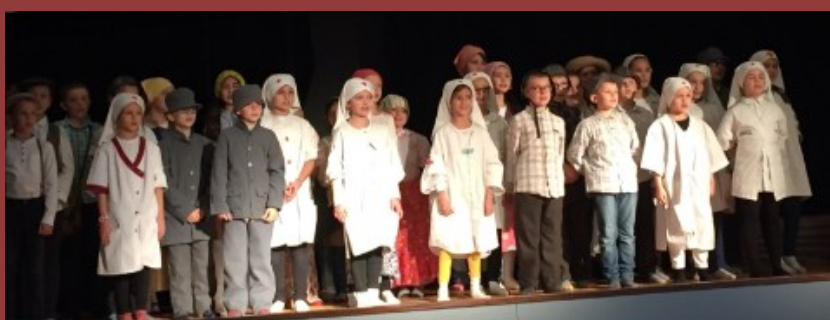
Spectacle de l'école Robert Mallet à Pont-Rémy dans le cadre des commémorations du 11 novembre 1918.