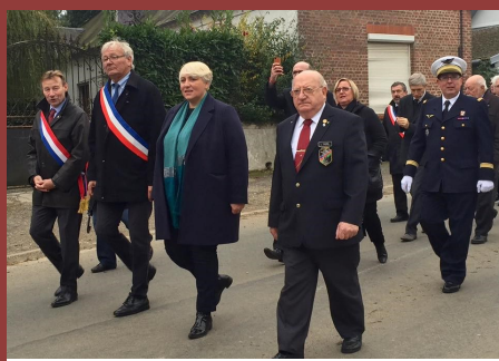
La ministre Pascale BOISTARD à la cérémonie du « Drakkar » à Ailly le Haut Clocher.