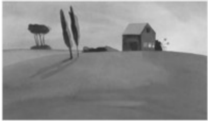
Jutta Bauer: Bona Nox

Les artistes ont des talents, moi aussi, je développe mes talents artistiques