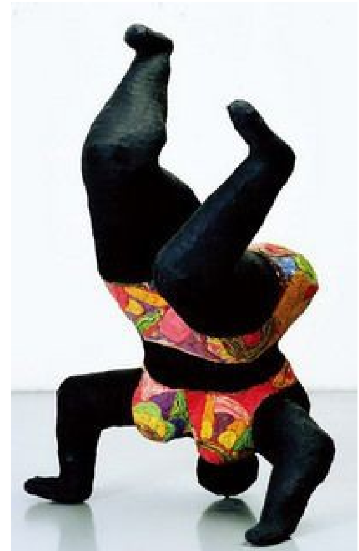
Nana noire upside down

J'observe et je reproduis la position de la Nana de Niki de Saint Phalle