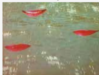
Les Bouches du Rhône d'Agnès Varda

Phare propose une sélection sur le thème du fleuve, du Cambodge à l'Australie en passant par le Vietnam, la Suisse et la France. Les Bouches du Rhône d'Agnès Varda ouvriront le bal aquatique avec humour et poésie puis céderont la place à des courts métrages engagés, drôles, sensibles et hypnotiques.