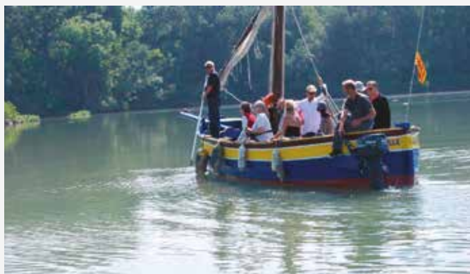
Visite fluviale

> Gratuit sur réservation auprès du CPIE au 04 90 98 49 09