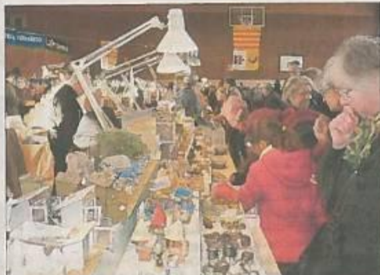
52 santonniers présentent leurs créations. 18 autres patientent sur la liste d'attente.