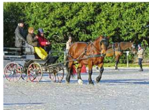
L'école d'attelage du Haras national reprend ses formations.

LE HARAS national des Bréviaires a publié son nouveau calendrier de formations. Elles s'adressent aux professionnels du monde équin et aux amateurs éclairés voulant se perfectionner. Des initiations à l'attelage, des formations au travail des longues rênes, au poulinage, à la préparation du jeune cheval en vue d'un concours etc. commencent dès ce mois-ci. Pour les cours de l'école d'attelage, il est possible de venir avec son cheval et/ou sa voiture d'attelage. Le prix de ces séances d'une à deux journées varie de 150 à 288 euros.