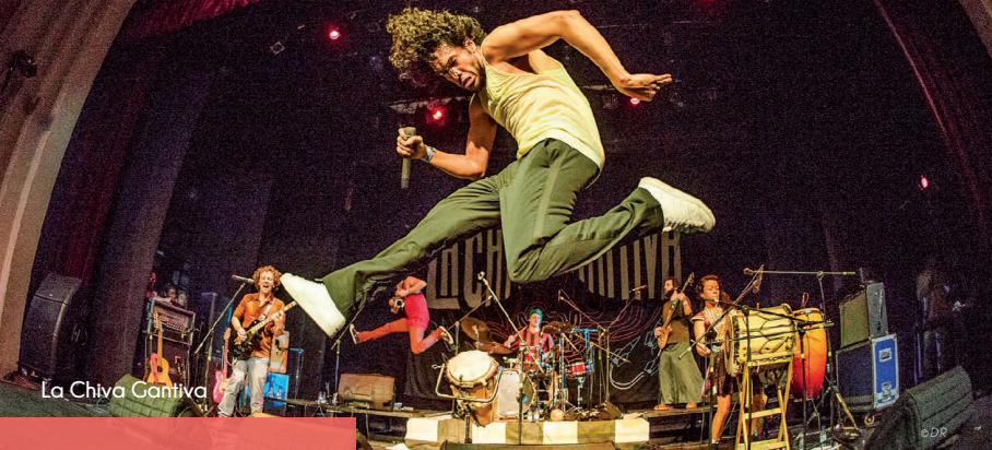
La Chiva Gantiva