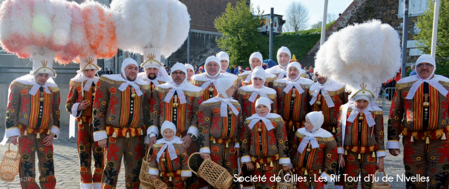
Société de Gilles : Les Rif Tout d'Ju de Nivelles