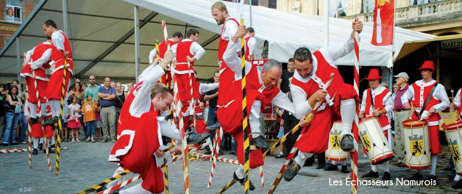
Les Échasseurs Namurois