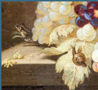
© Roelof Koets - Coupe de raisins et de pêches (détail) - Musée des Beaux-Arts d'Orléans / Christophe Camus

au 02 38 79 21 83 ou 86 à partir du 21 mars, maximum 12 enfants (annulation possible si moins de 8 enfants inscrits).