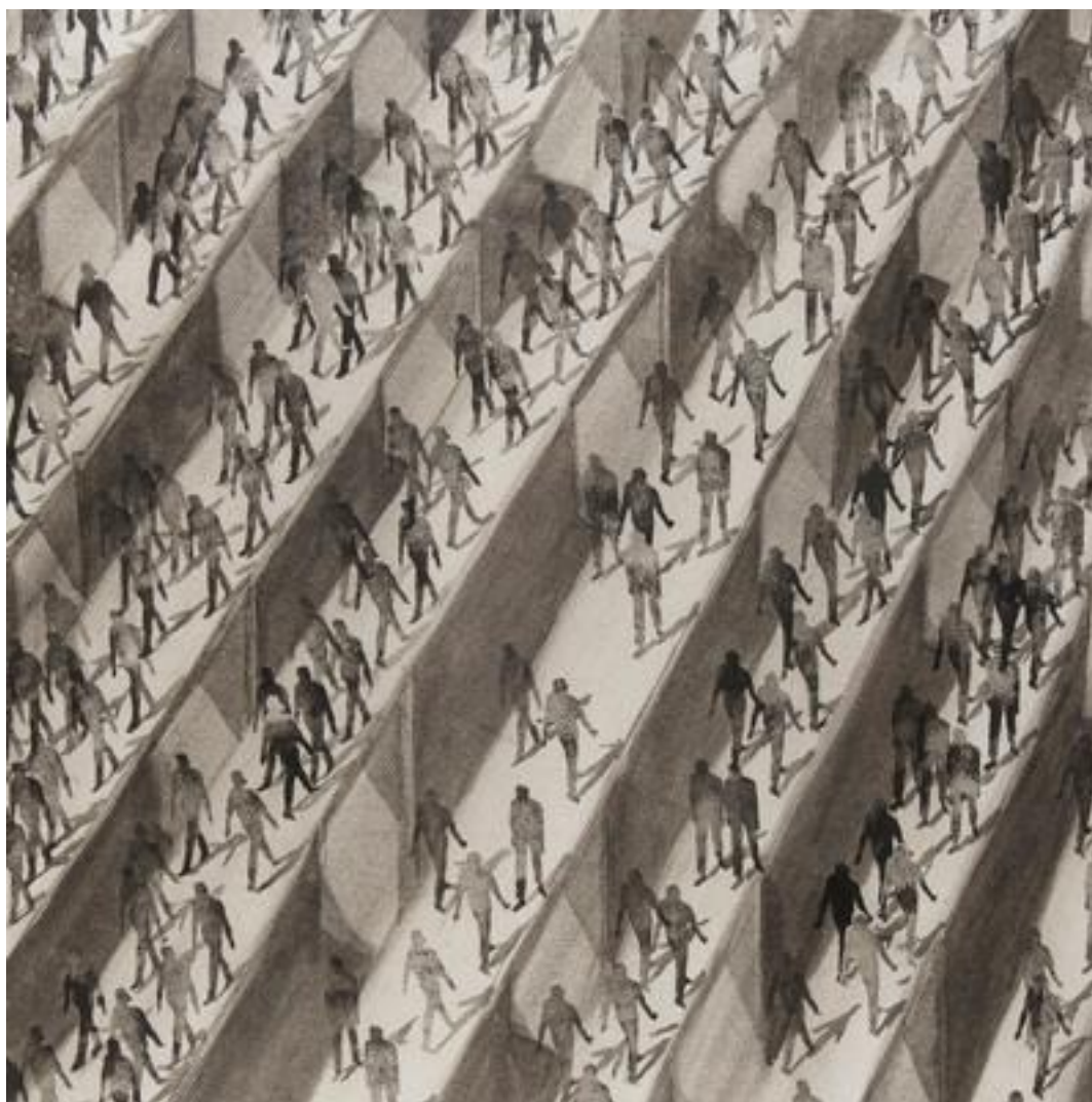
Jean-Pierre Stora, « Allées piétonnières », 1995, lavis et encre de Chine, 64 × 50

On a le sentiment d'une foule pressée et abondante, dont les membres circulent rapidement en se croisant, mais sans prendre le temps d'échanger.