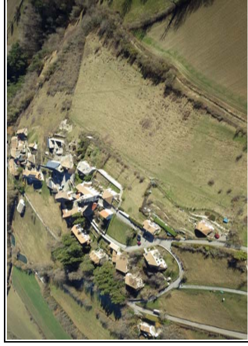
Vol en parapente de Jean-Paul Reynaud depuis le col du Prayer 23/12/14

Tout savoir sur le budget de votre commune : http://www.collectivites-locales.gouv.fr