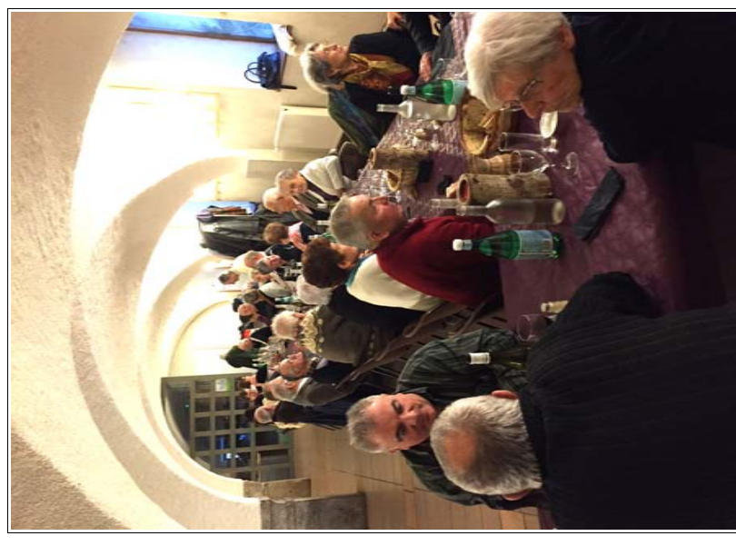
Repas de Noël des anciens en décembre dernier