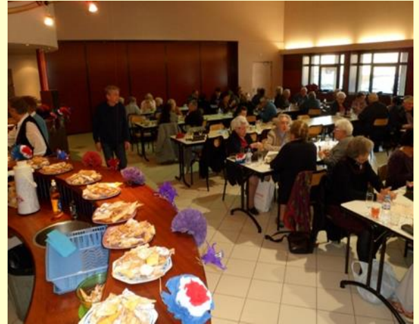
Conscrits 2015 et son goûter