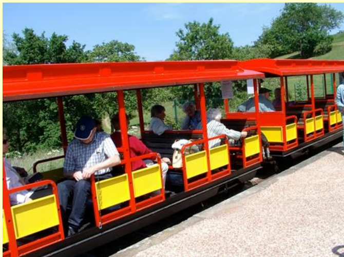
Certains sont restés dans le train

Nous avons eu de nouveaux adhérents ces derniers temps ; de jeunes retraités sont venus renforcer l'équipe en aidant au rangement.