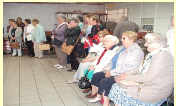
Une partie du groupe