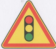
Annonce de signaux lumineux réglant la circulation.