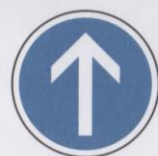
Direction obligatoire à la prochaine intersection : tout droit.