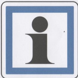
Informations relatives aux services ou activités touristiques.