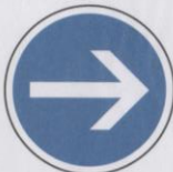
Obligatoire de tourner à droite avant le panneau.