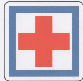
Poste de secours.