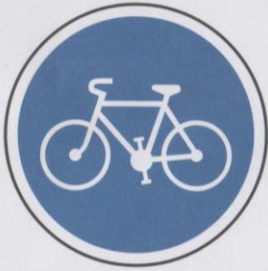
Piste ou bande obligatoire pour les cycles sans side-car ou remorque.