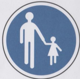
Chemin obligatoire pour piétons.