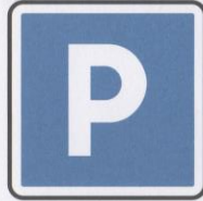
Parc de stationnement.