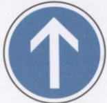
Direction obligatoire à la prochaine intersection : tout droit