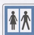
Toilettes ouvertes au public.