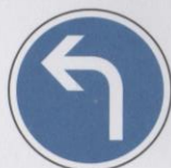
Direction obligatoire à la prochaine intersection : à gauche.