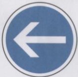
Obligatoire de tourner à gauche avant le panneau.