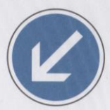
Contournement obligatoire de l'obstacle par la gauche.