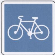
Début de piste ou bande cyclable conseillée.