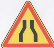
Chaussée rétrécie par la droite et/ou la gauche.