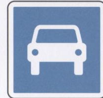
Route à accès réglementé.