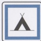
Camping pour tentes.