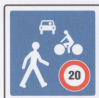
Zone de rencontres.