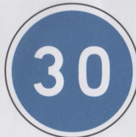
Vitesse minimale obligatoire.