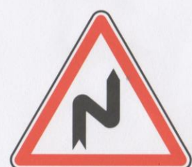
Succession de virages dont le premier est à droite.