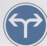
Directions obligatoires à la prochaine intersection : à droite ou à gauche.