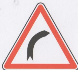
Virage à droite.