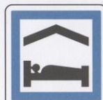
Chambre d'hôtes ou gîte.