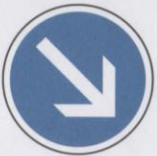
Contournement obligatoire de l'obstacle par la droite.