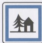
Auberge de jeunesse.