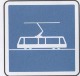
Arrêt de tramway.