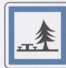
Emplacement pour pique-nique.