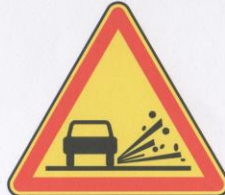
Projections de gravillons.