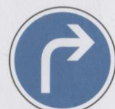
Direction obligatoire à la prochaine intersection : à droite.