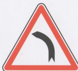
Virage à gauche.