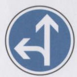
Directions obligatoires à la prochaine intersection : tout droit ou à gauche.