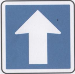
Circulation à sens unique.