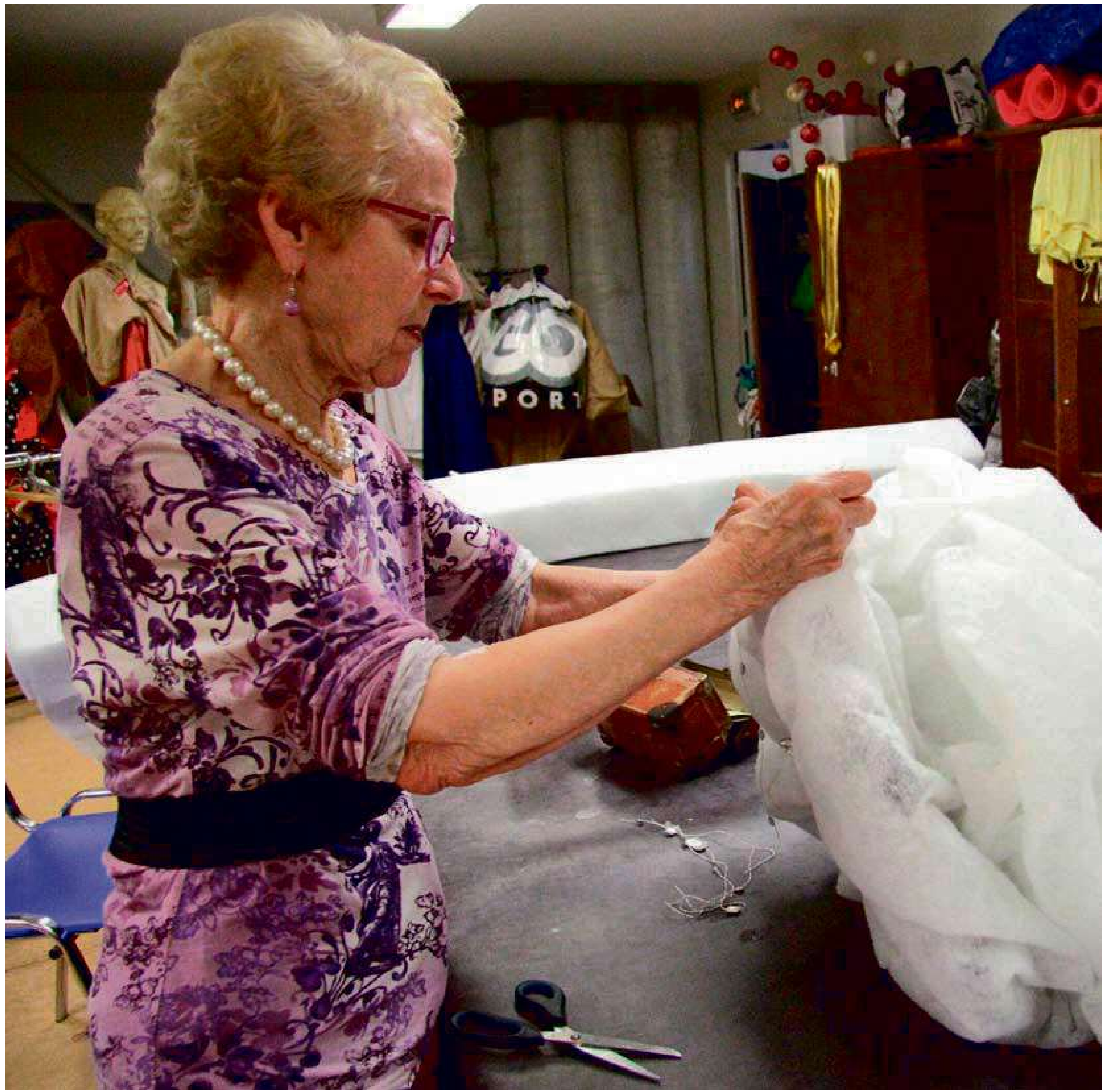
Et l'atelier fabrication de costumes. Ici, sur le thème de l'air avec les nuages.

Une création autour des acrobaties et des machineries, signée par la