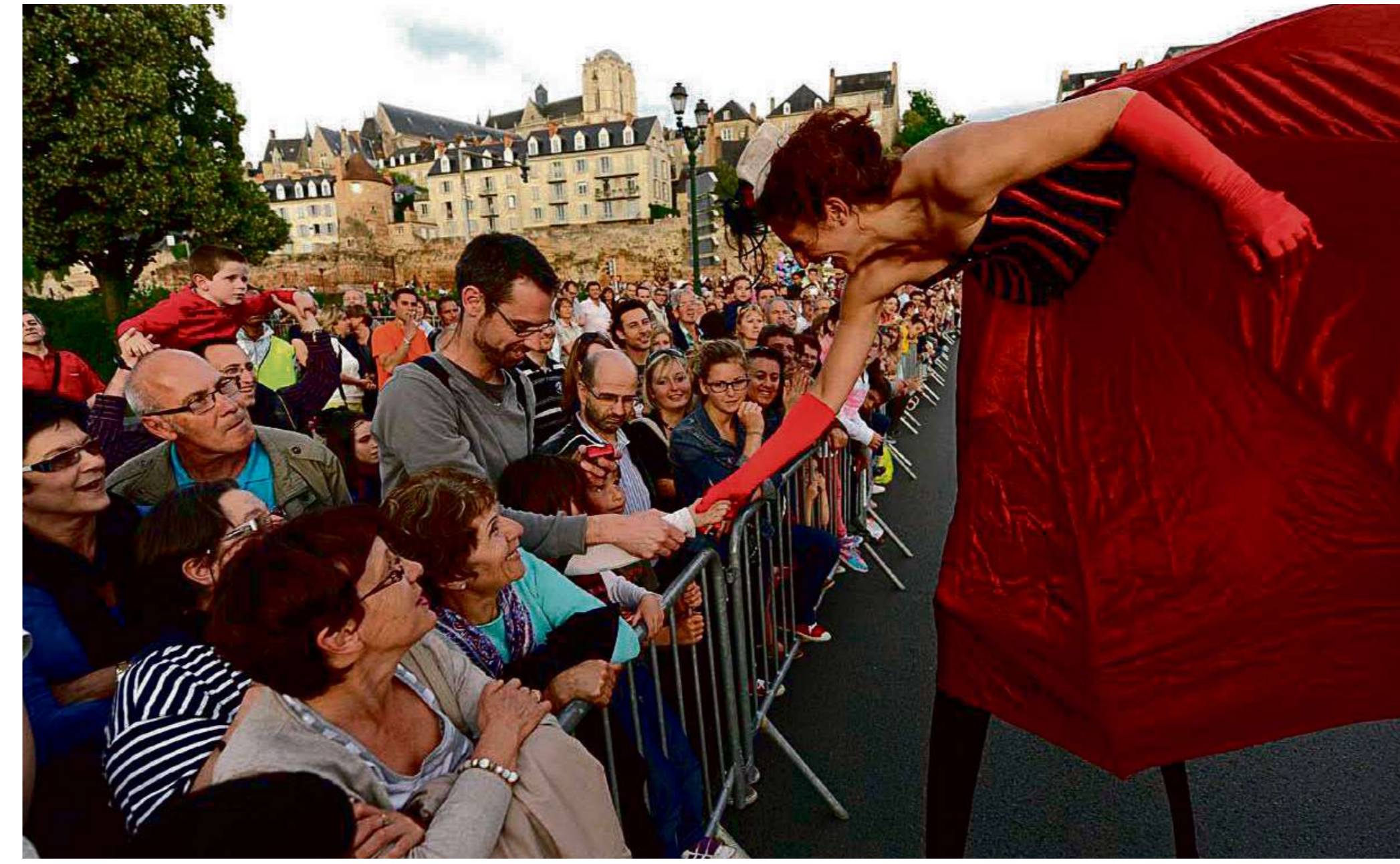
La parade va de nouveau drainer la foule, samedi 25 juin.

De 4 € à 10 € le spectacle, pour Que Nervious , Péripéties , Entre chien et loup et Boléro . Billetterie à l'accueil du Village, à l'arrière du théâtre. Tous les autres spectacles sont gratuits et sans billets. Réservations néanmoins obligatoires pour les spectacles Au point du jour , de la compagnie Presque siamoises, pour Mission Roosevelt et pour la projection du documentaire, Quel cirque , au cinéma Pathé.