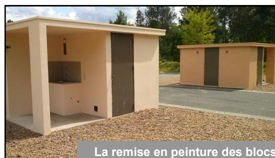
La remise en peinture des blocs sanitaires se poursuivra en 2014