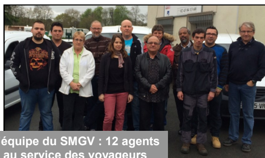
L'équipe du SMGV : 12 agents au service des voyageurs