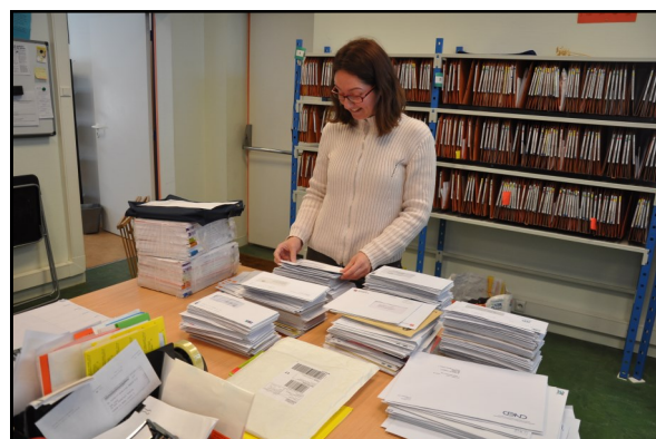
Le suivi du courrier, l'une des principales missions assurées par le Centre social

L'année 2013 représente la 1 ère année du financement du Centre social « Voyageurs 72 » par le SMGV. La participation financière à la charge des collectivités membres du SMGV est donc passée de 1,20 € à 1,35 € par habitant. Le montant de cette subvention de fonctionnement pour l'association Voyageurs 72 s'élevait en 2013 à 49.678,35 €.