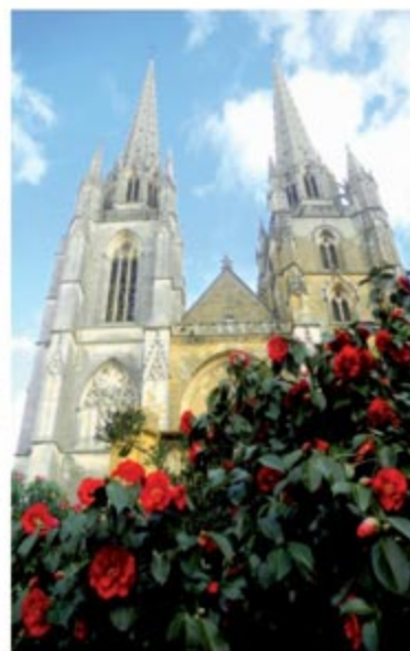
Photos de couverture c'est le printemps

Le printemps (de l'ancien français prins, premier, et temps) est l'une des quatre saisons de l'année, dans les zones tempérées. Il suit l'hiver et précède l'été.