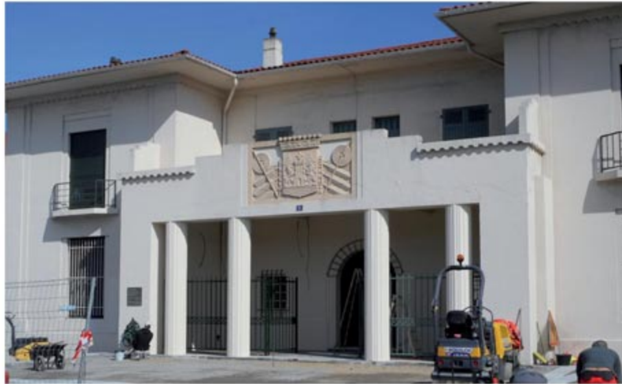
L'architecture Gomez dans le quartier Saint-Esprit

À l'intérieur, un magnifique granito (sol poli de fragment de pierres naturelles), cachées des regards pendant plusieurs années, a été restitué au rez-de-chaussée sur les zones retrouvées, témoin des cloisonnements d'origine des salles et bureaux de la bourse et de l'inscription maritime.