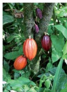
Un cacaoyer portant des cabosses