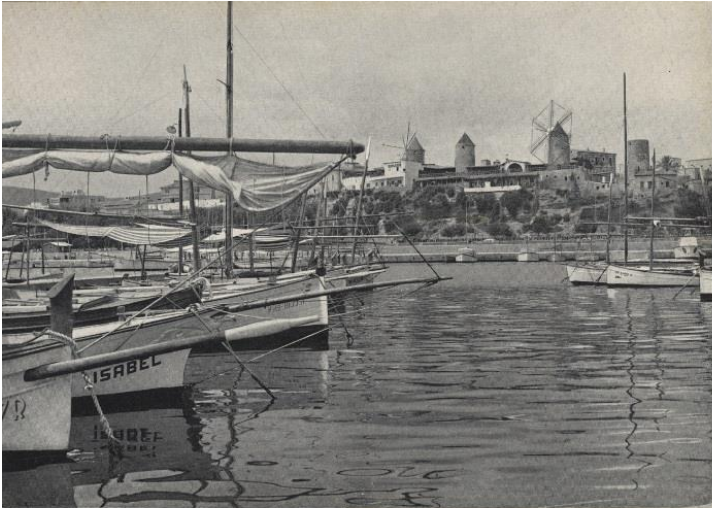
Palma de Mallorca