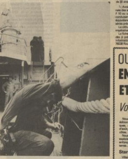
Tout est fait prêt à bord du remorqueur de haute-mer « Abelle Provence » qui aura la lourde tâche de remorquer le « Norway » à bord aux chaudières navales de Brème. L'équipage restera, hier après-midi la dernière main aux commandes.