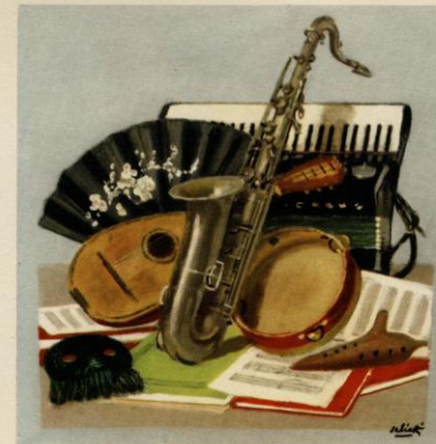
Programme musical du 12 juillet 1956