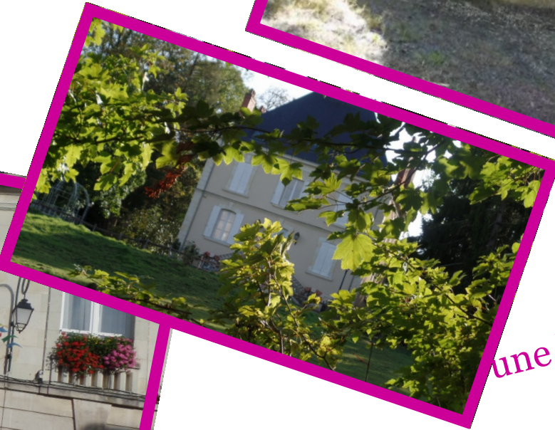
une belle petite maison