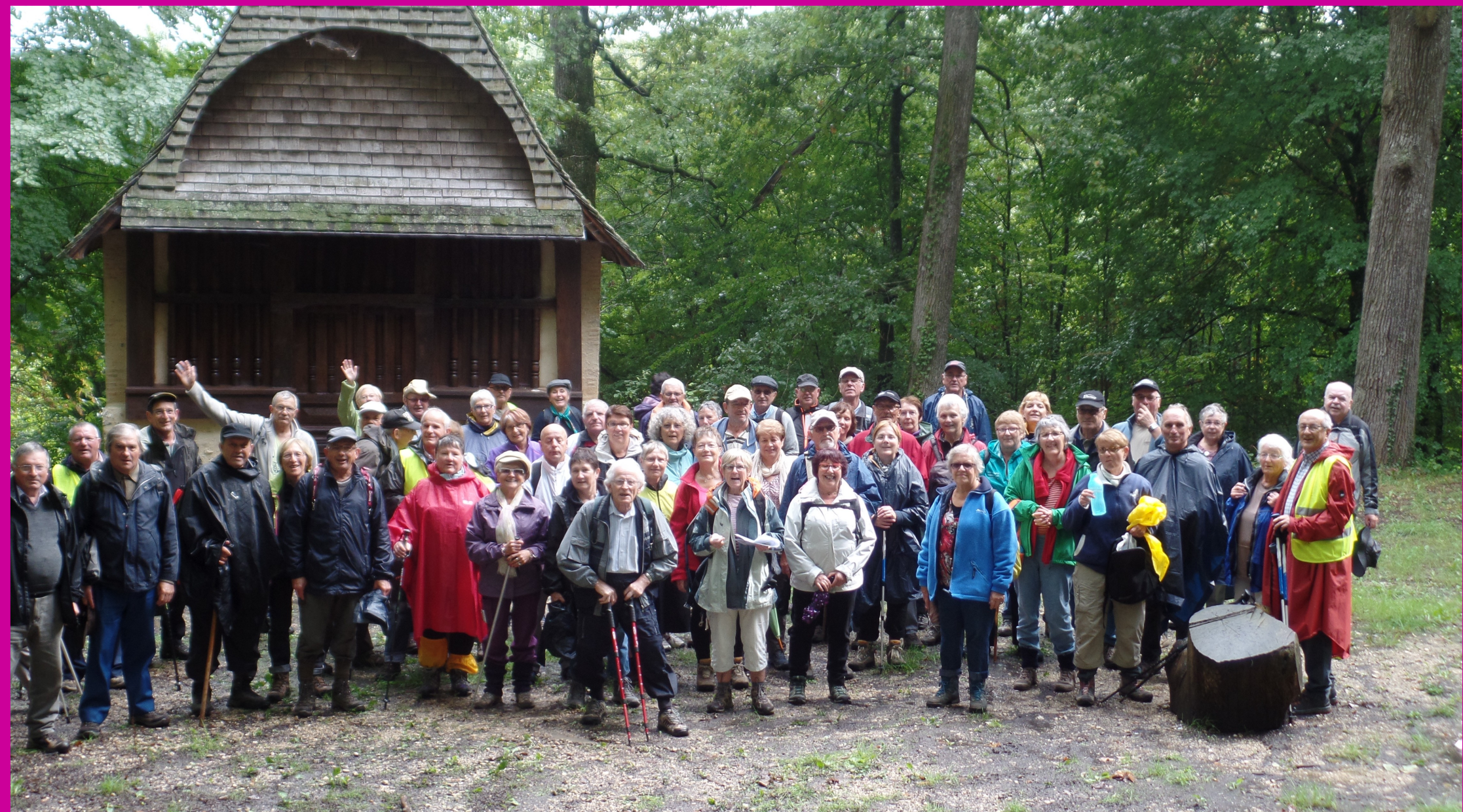
Nos 60 randonneurs Avec le sourire !!!