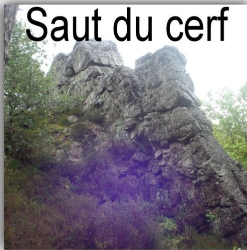
Saut du cerf