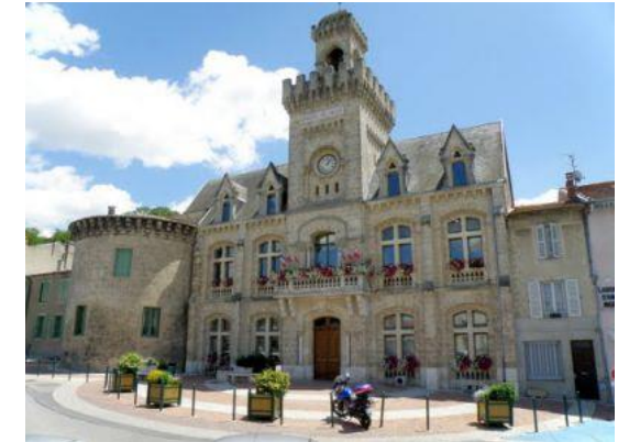
Portes médiévale et hôtel de ville de Chabeuil.