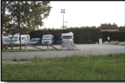
Aire de Camping car à proximité de la piste