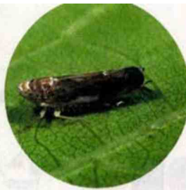
La cicadelle propage une maladie de la vigne très grave. Pour lutter contre ce fléau, les traitements chimiques restent indispensables.

Face à la flavescence, il n'y a pas d'autres remèdes que l'arrachage et la chimie de synthèse. En 2010, l'association interprofessionnelle des vins biologiques du Languedoc-Roussillon a testé les remèdes bio contre la flavescence dorée. Jugement sans appel : « La majorité des produits naturels testés dans le cadre de ces expérimentations présentent un niveau d'efficacité tout à fait insuffisant pour