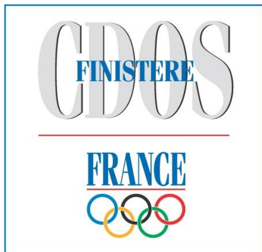
COMITE DEPARTEMENTAL OLYMPIQUE ET SPORTIF