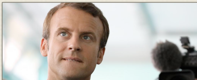
Emmanuel Macron continue de perdre des points et fait (beaucoup) moins bien que François Hollande à la même époque.

Emmanuel Macron n'est plus considéré comme un bon président par 56% des Français, selon un sondage Odoxa publié lundi. Il a perdu 14 points depuis le mois de juin et fait (encore) moins bien que François Hollande à la même époque. Enfin, la cote de popularité d'Edouard Philippe n'est pas flamboyante non plus.