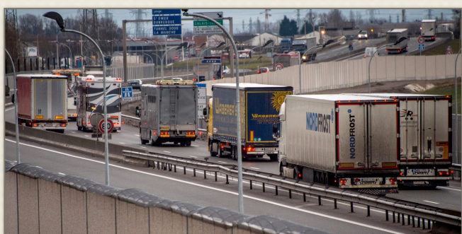
Les chauffeurs routiers vont mener des actions dans toute la France.