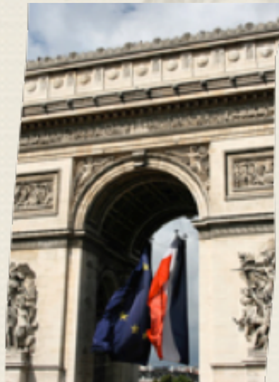
Diez Gérard La Presse en Revue

I) Pour plus de la moitié des Français, la politique du gouvernement sert "les plus aisés"