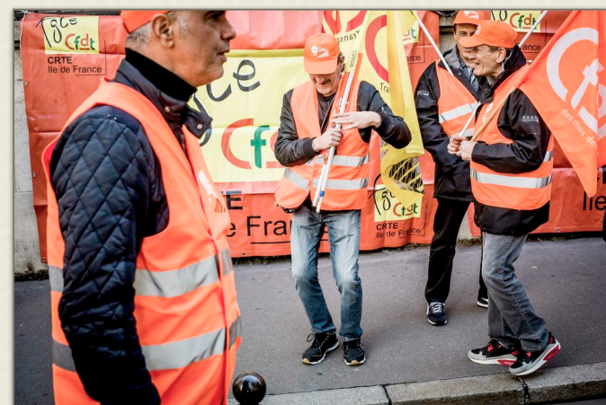
Des membres de la CFDT ont manifesté lundi devant le ministère du Travail.

Transport, fonction publique, retraités... Au-delà de la loi travail, les secteurs appelant à la mobilisation contre le gouvernement sont de plus en plus nombreux. Mais avancent en ordre dispersé.