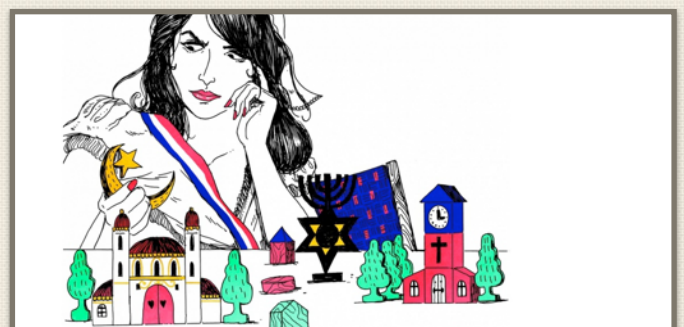
Marianne face à la laïcité, vue par David Lanaspá. (©David Lanaspá pour L'OBS.)