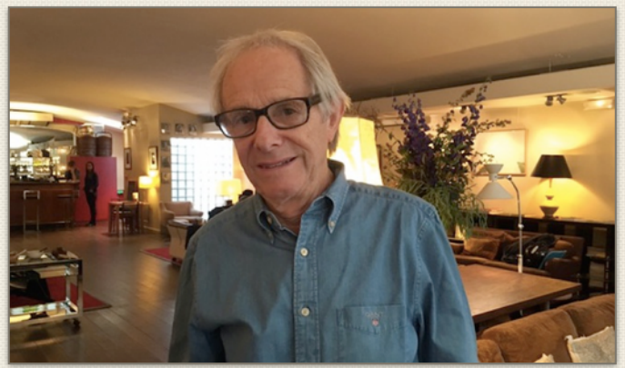
Ken Loach, au cinéma du Panthéon, à Paris, le 13 octobre 2016.

C'est cet horizon perdu et cette mémoire disparue, tous deux balayés par les années Thatcher puis Blair, que Loach tente de faire vivre et revivre, alors même qu'il assiste lui-même à un événement qu'il ne pensait plus voir s'animer que dans ses films : celui d'un parti travailliste ayant remis la barre à gauche, et épousant ses vues sous l'égide de Jeremy Corbyn. C'est surtout de cela que nous avons voulu parler avec le détenteur de la Palme d'or de 2016. Car la sincérité de son engagement ne souffre, elle, d'aucune controverse esthétique.