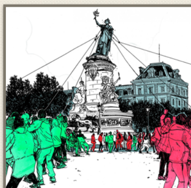
Illustration : David Lanaspas pour "L'OBS"

Depuis la conversion soudaine de Marine Le Pen à la laïcité et depuis que des groupes auxquels je me suis opposée dès leur création, comme Riposte laïque, utilisent ce beau mot pour mener une croisade identitaire, on assiste à des retournements inouïs. Les descendants de la droite cléricale la plus intransigeante, celle à qui la loi de 1905 a dû être arrachée, essaient de nous expliquer qu'ils en sont les héritiers et qu'elle ne s'applique qu'aux musulmans. C'est une trahison absolue de tout ce que représente la séparation. Il faut y résister.