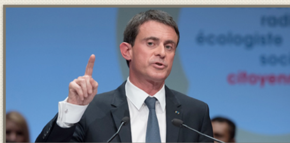
Manuel Valls lors de son discours à l'une "université de l'engagement" du PS, samedi 22 octobre

Alors que le Premier ministre agite le spectre d'une élection de la droite dans des habits présidentiels, les candidats à la primaire PS taclent son manque d'idées et son bilan.