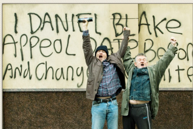
À gauche, Daniel Blake (Dave Johns) devant son « installation artistique »

Comment allons-nous survivre ? Comment préservons-nous les ressources naturelles ? C'est évident. La vraie question, c'est : « Comment y arriver ? » Les gens se battent pour des combats qui les concernent directement. Il y a tous les jours des campagnes pour sauver un hôpital local ou une salle d'urgence. Les gens se battent, car ils