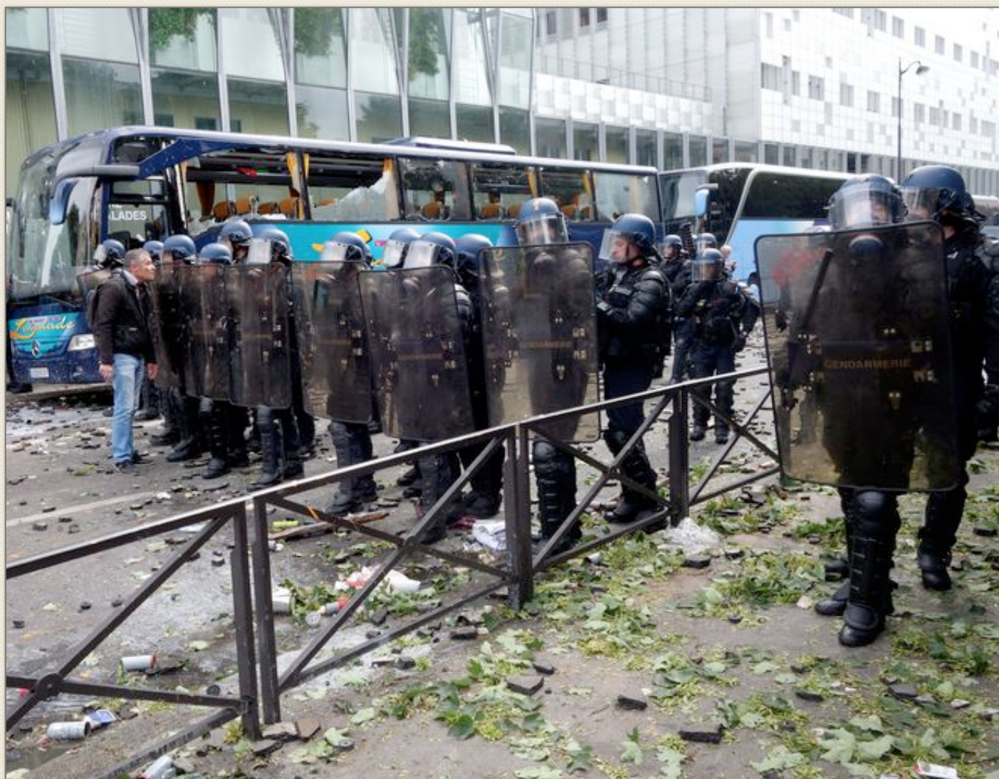
Un manifestant harangue les CRS près de l'hôpital Necker à Paris.

Partout, en Europe, le syndicalisme est fragilisé. Est-ce qu'un mouvement social comme celui-ci peut le renforcer ou l'affaiblir encore ?