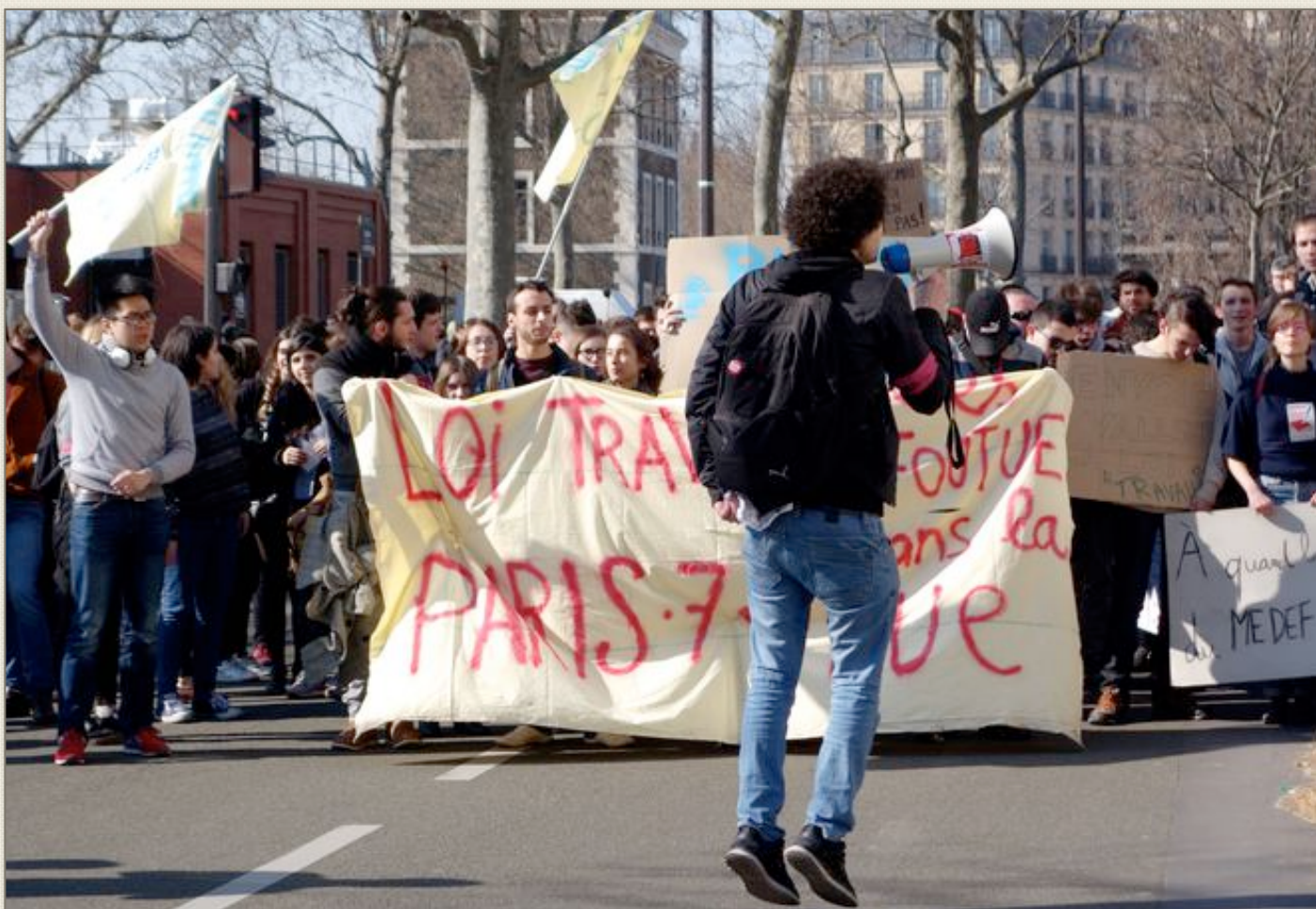
Manifestation des étudiants et lycéens contre la loi sur le travail, le 17 mars 2016 à Paris.

Répression policière extrême, casseurs, locaux de la CFDT puis de la CGT vandalisés... La violence – physique mais aussi verbale – est omniprésente dans ce mouvement. « Lider Maximo », « Zapata », « Fidel Castro »... Vous avez été, Philippe Martinez, la cible de toutes les accusations. Comment expliquez-vous cette débauche de violences ?