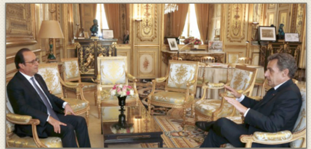
Les Français adorent l'élection présidentielle

On aurait pu croire que Hollande et Sarkozy auraient détruit la magie de la présidence pour ne pas avoir été à la hauteur des souhaits des Français. Pourtant le président élu demeure à leurs yeux le mythe de la réconciliation entre royauté et République.