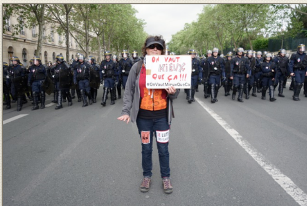
Paris, 12 mai 2016, manifestation contre la loi sur le travail et le 49-3.

Bernard Thibault : Il y a aussi pour ce gouvernement le contrecoup de la déchéance de nationalité qu'il n'a pas réussi à faire passer. Avec la réforme du code du travail, qui ne figurait pas dans le programme de Hollande, il s'agit de prendre une revanche, de ne pas échouer une deuxième fois.