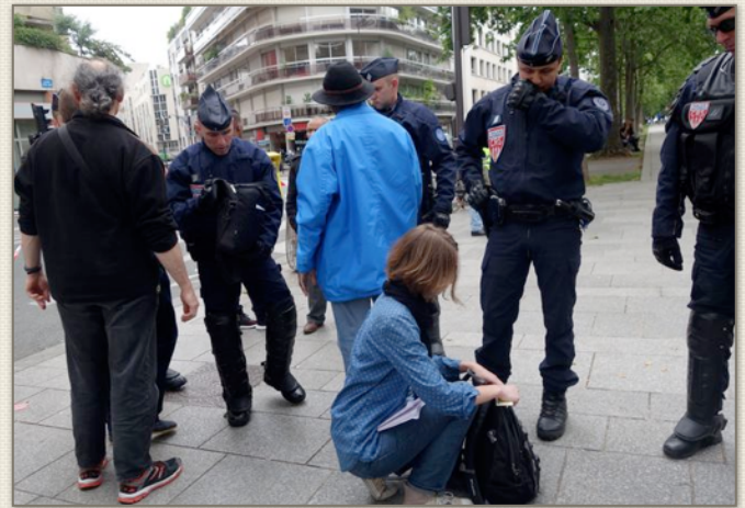
Fouilles et palpations au corps, métro Bréguet-Sabin, Paris, 28 juin 2016.

C'est vrai qu'on ne pense pas à la France mais à d'autres pays devant une interdiction de manifester.