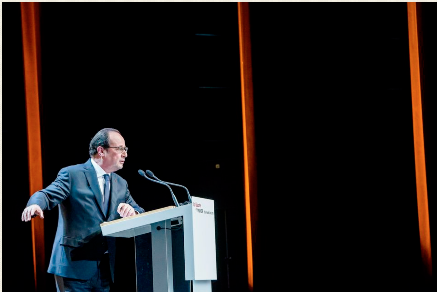
François Hollande au théâtre du Rond-Point pour le colloque «la gauche et le pouvoir», mardi à Paris.

François Hollande ne veut plus se cacher : depuis mardi, il a décidé d'entrer de plain-pied dans la campagne pour sa réélection. Certes, il n'est pas encore candidat, mais il s'y prépare activement. Désormais à la vue de tous. «Même si sa candidature n'est pas encore certaine car elle reste conditionnée à la baisse du chômage, il fera tout jusqu'au bout pour se retrouver en position», confirme un intime. Nous y voilà donc. L'heure n'est pas aux promesses ou au programme, mais à la défense d'un quinquennat qui, de l'aveu même des proches du chef de l'Etat, est devenu totalement illisible, notamment pour son électorat. Préparation