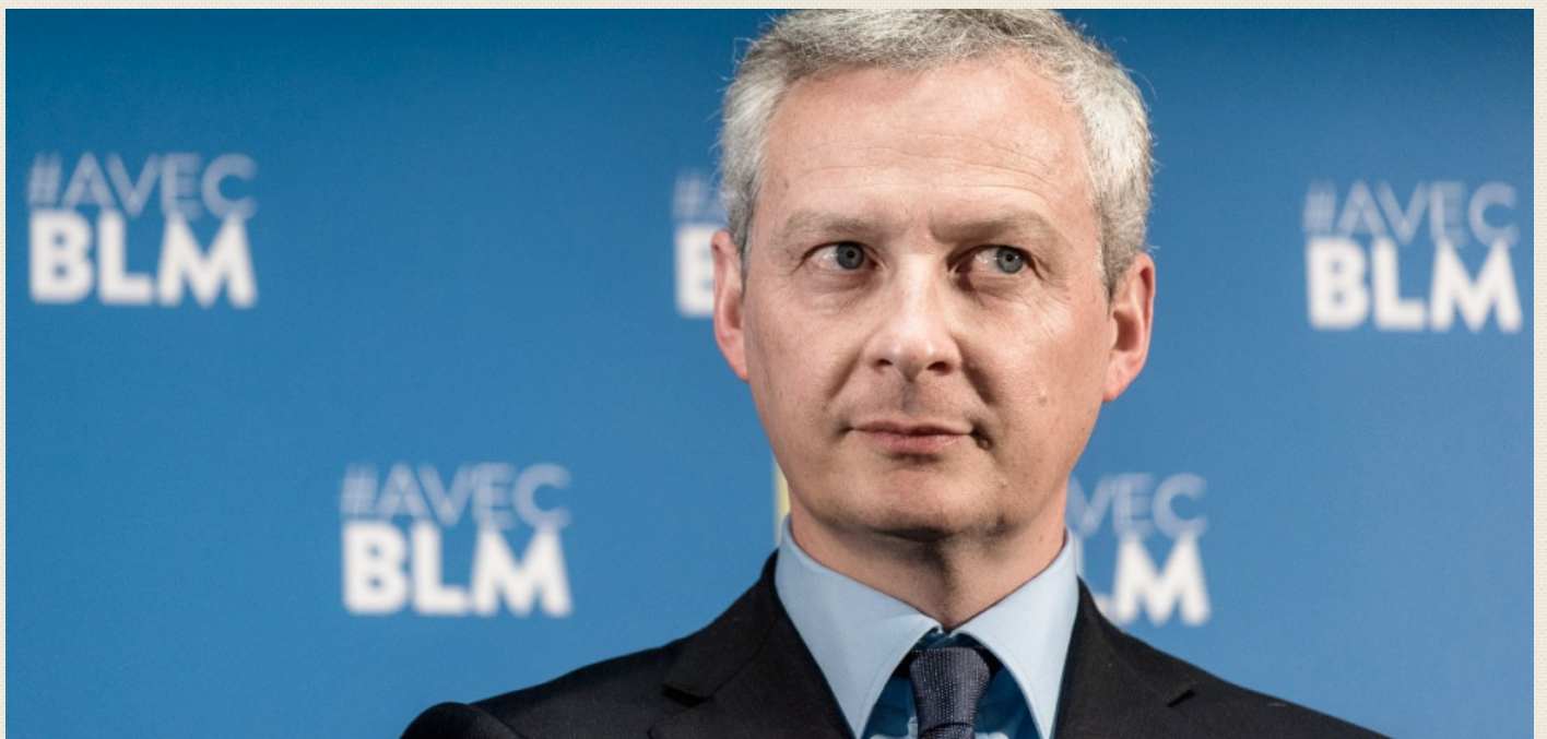
Bruno Le Maire, le 27 avril 2016 à Paris.

I) Au secours, la droite (ultralibérale) revient !