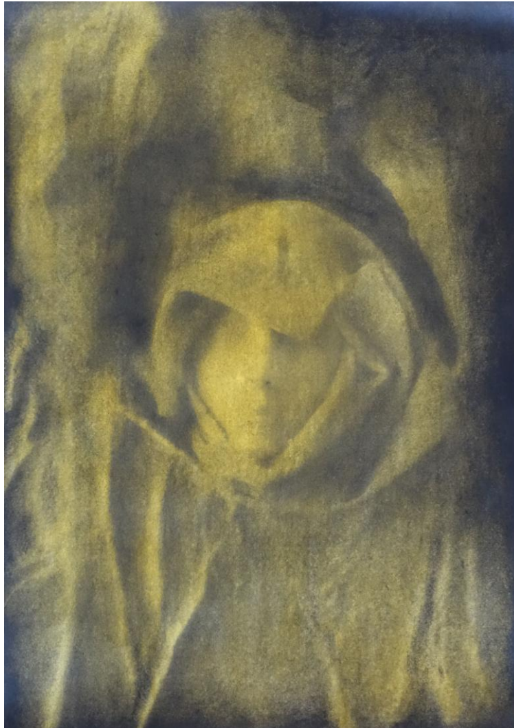
Marianic Parra 2015 «Silence non gardé – Déclinaison III» dessin gouache sur papier 29,7-42 cm

tu ressembles équilibre gardé dans la vie qui passe à un homme qui va vers les hommes