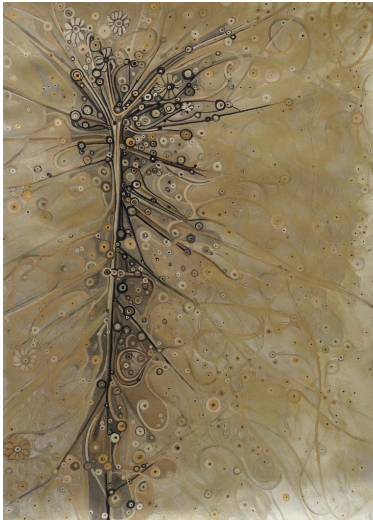
Marianic Parra 2015 «Dans le lointain du rêve – Déclinaison II» Drawing gouach on paper 29,7-42 cm

le soleil suspendu occupe dans la permanence de la vie vivante tout