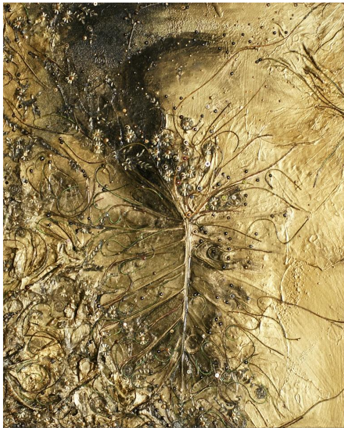
Mariane Parra 2011 «Dans le lointain du rêve» Mixed media 45-55 cm

je vois contraint à l'anxiété et à l'espérance le retour de la nuit de nouveau béante qui traverse le souvenir le non-souvenir l'obscurité