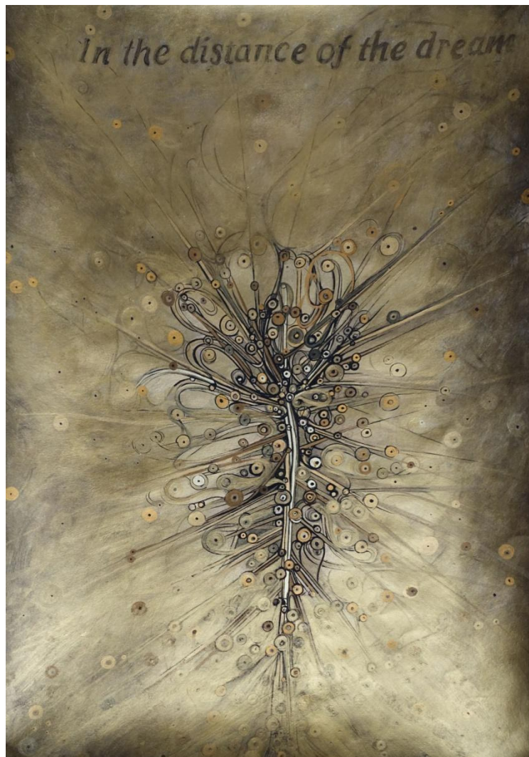
Mariane Parra 2015 «Dans le lointain du rêve – Déclinaison III» Drawing gouach on paper 29,7-42 cm

tu ressembles équilibre gardé dans la vie qui passe à un homme qui va vers les hommes