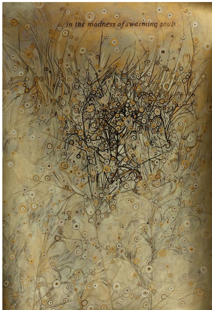
Marianic Parra 2015 « Vie Minuscule – Déclinaison IV » Dessin Gouache sur papier 29,7-42 cm

tu brises enchaîné à ce qu'il faut dépasser les limites