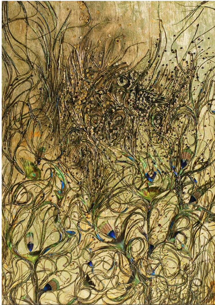
Marianic Parra 2011 «Vie Minuscule» Mixed media 50-70 cm

tu rencontres dans la folie des âmes grouillantes la multitude qui revisite portes de l'enfance closes la Terre oubliée trahie