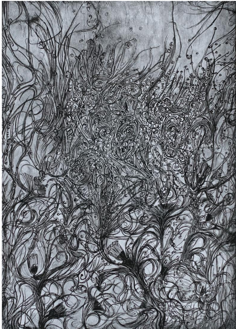
Marianic Parra 2015 «Vie Minuscule – Déclinaison I» Dessin Gouache sur papier 29,7-42 cm

tu révéles gardées dans le cœur les choses anciennes