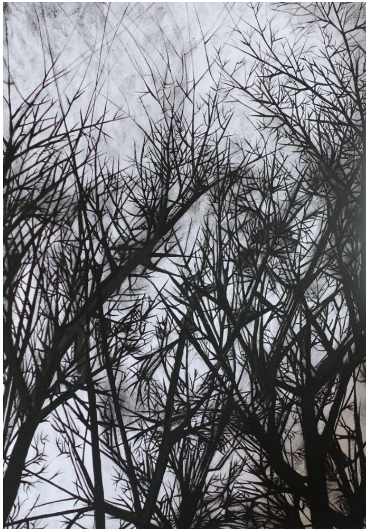
Marianic Parra 2015 « Variation VIII » Dessin Gouache sur papier 29,7-42 cm