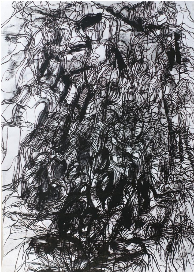
Marianic Parra 2015 « Variation V » Dessin Gouache sur papier 29,7-42 cm