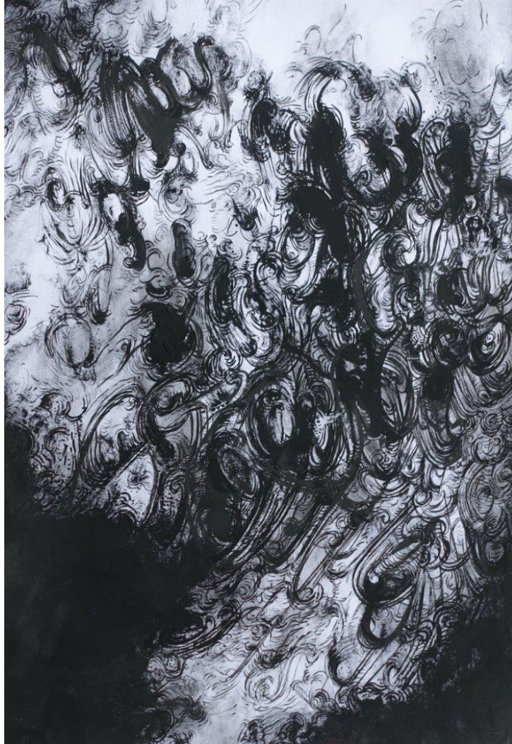
Marianic Parra 2015 « Variation III » Dessin Gouache sur papier 29,7-42 cm