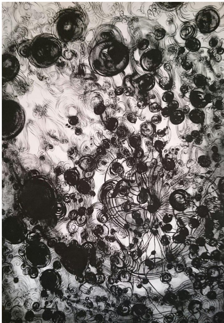
Mariane Parra 2015 « Variation X» Dessin Gouache sur papier 29,7-42 cm