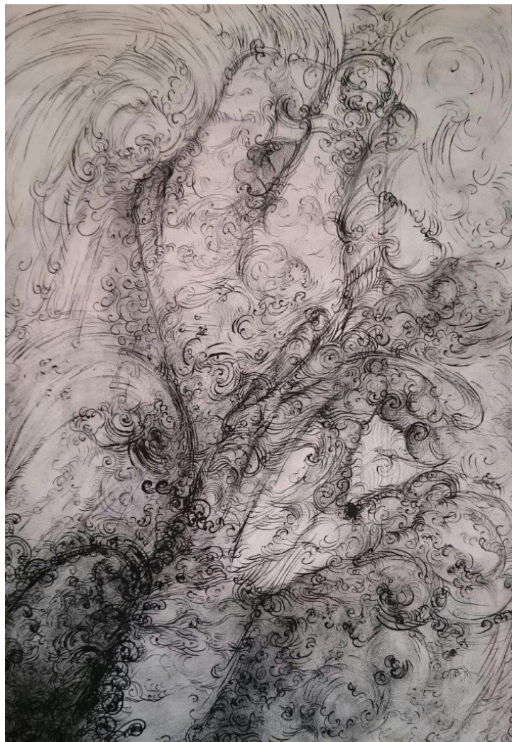
Marianic Parra 2015 « Variation IX» Dessin Gouache sur papier 29,7-42 cm