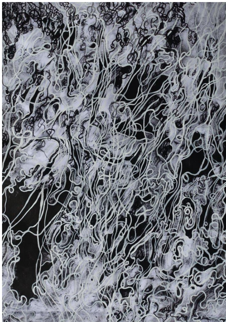
Marianic Parra 2015 « Variation I » Dessin Gouache sur papier 29,7-42 cm