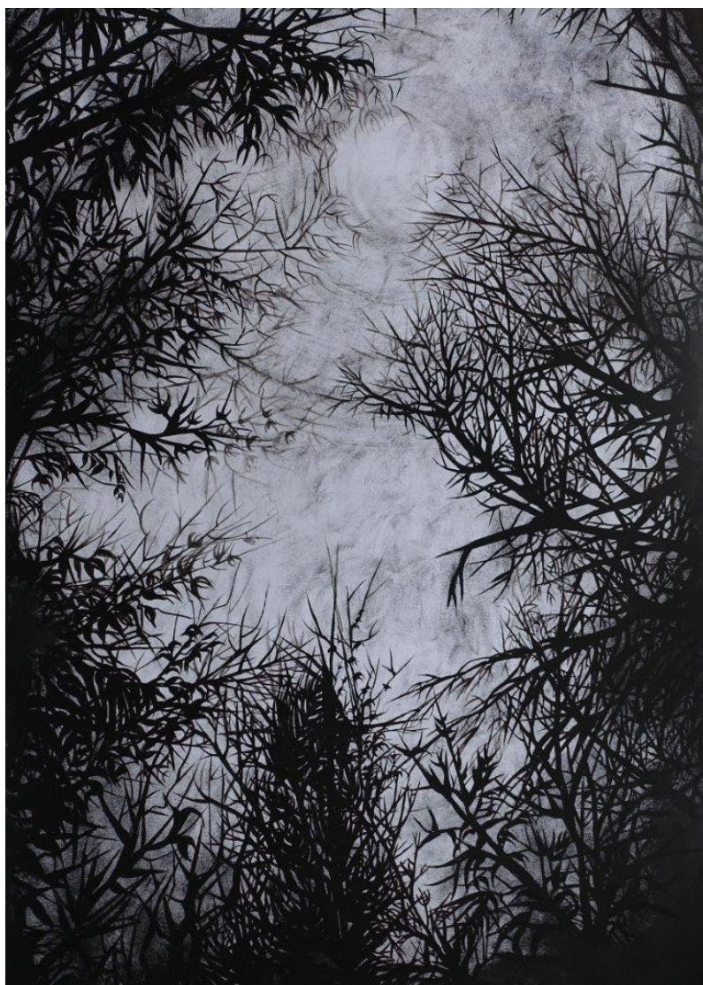
Marianic Parra 2015 « Variation VII » Dessin Gouache sur papier 29,7-42 cm