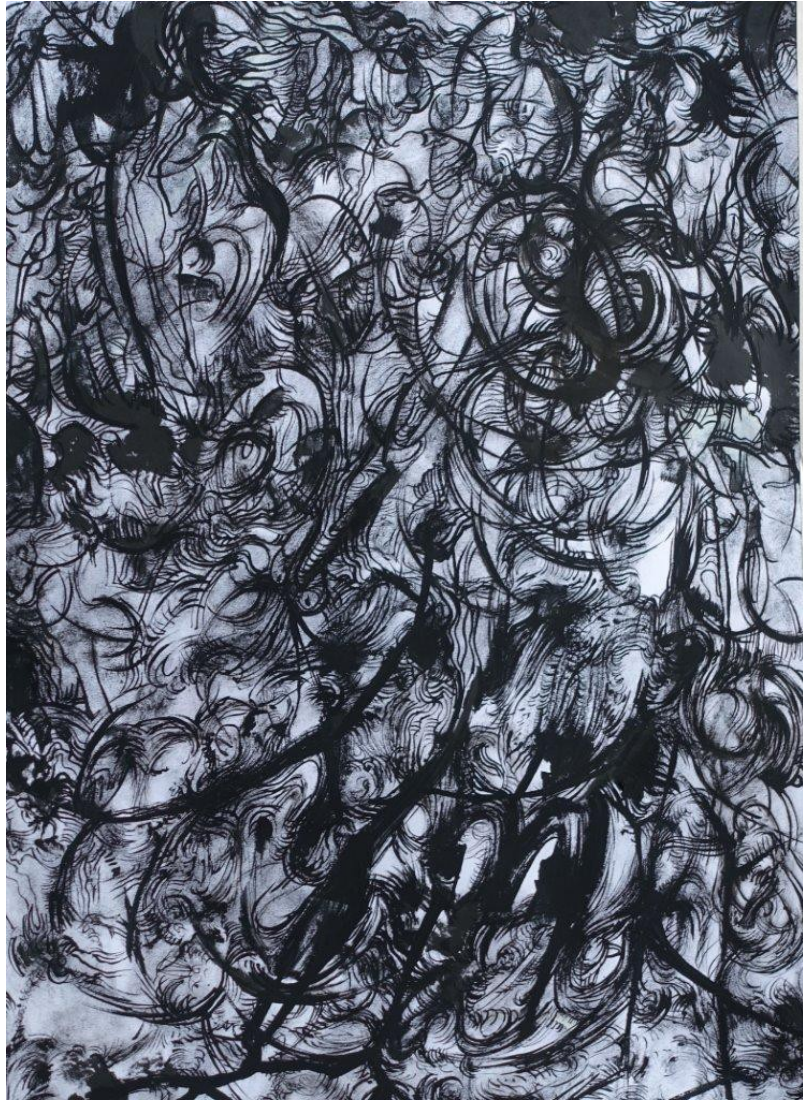
Marianic Parra 2015 « Variation I » Dessin Gouache sur papier 29,7-42 cm Variations II

Sans trembler dans la vertigineuse frénésie