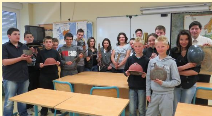
Les élèves de la section SEGPA du collège Paul Portier de Bar sur Seine