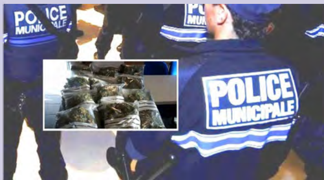
La Penne-sur-Huveaune : 150 kilos de cannabis découverts par la police municipale

Sans doute que ce soir, les agents de la police municipale de la Penne-sur-Huveaune vont sabrer le champagne! Dans la matinée, une patrouille a eu l'incroyable flair de s'intéresser à des véhicules stationnés sur un parking isolé, près de la résidence des arcades. Leur arrivée a rapidement engendré le départ en trombe de deux puissants véhicules et la fuite à travers champ d'un individu, qui a abandonné une Citroën C4 avec à l'intérieur... 150 kilos de résine de cannabis répartis dans 5 sacs !