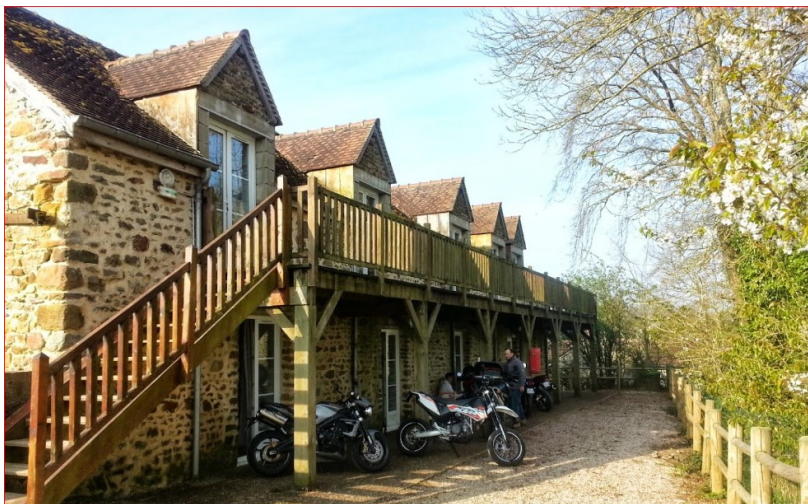
Votre GÎTE Le Moulin du Désert