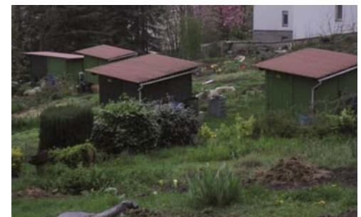
Photos Jardins Volpette