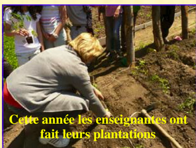
Cette année les enseignantes ont fait leurs plantations