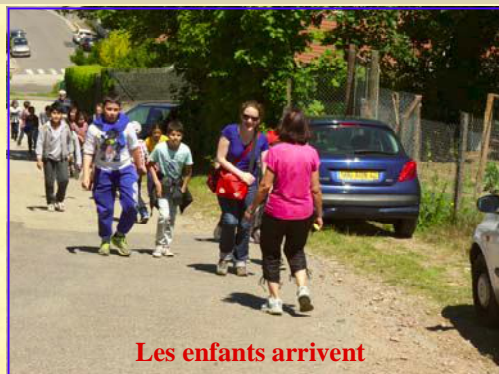
Les enfants arrivent