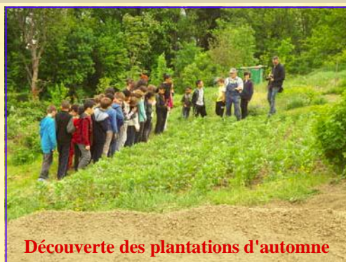
Découverte des plantations d'automne

Les apprentis jardiniers sont de retour depuis le début du mois de mai à la section pédagogique de Bel'Air.