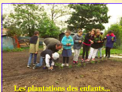
Les plantations des enfants...