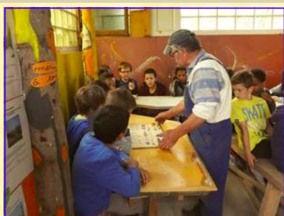
Le travail en atelier