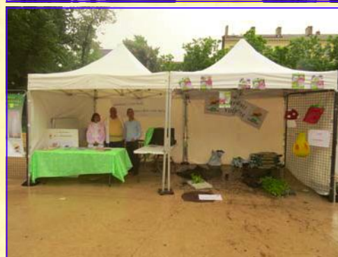
Une partie des bénévoles des Jardins Volpette