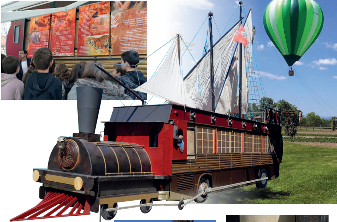
Vols captifs en mongolfière

Embarquez à bord de la Loco-voilier pour un retour vers la nature : à bord de son spectaculaire vaisseau, le capitaine Marin vous invite à la découverte de la biodiversité. Dans un décor à mi-chemin entre rêve et réalité, prenez part à cette fascinante aventure culturelle et pédagogique.