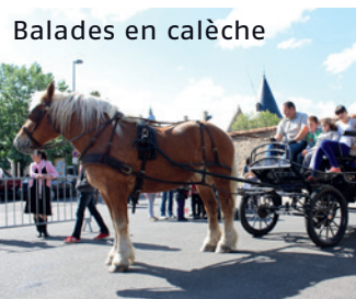
Balades en calèche