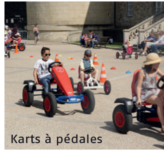
Karts à pédales