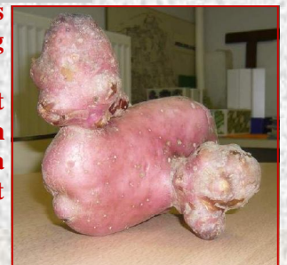
La pomme de terre en forme de chien.

Notre stand a eu énormément de succès et les félicitations des visiteurs. Nous avons répondu à de nombreuses questions sur le jardinage et les Jardins Volpette.