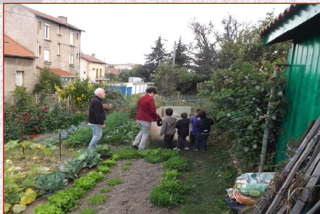
Un groupe d'enfants