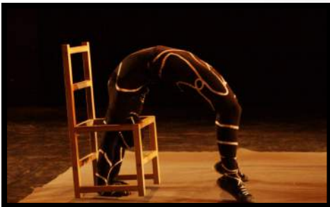
Espion : numéro en solo d'acrobatie sur chaise