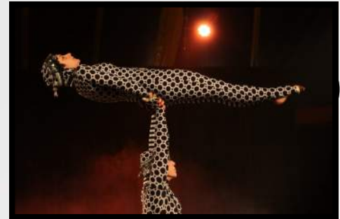
Hypnose : numéro en duo de main à main en souplesses