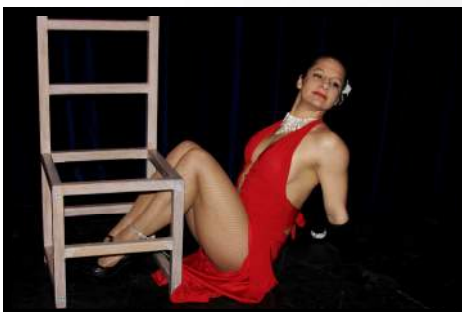
Miss Chair : Numéro en solo d'acrobatie sur chaise sexy burlesque