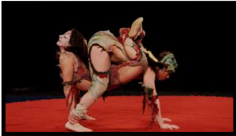
Les Yupa : numéro en duo de main à main dynamique et emprunt d'animalité

Nous vous proposons à la carte des numéros de cirque (de 5 à 8 min) Ebouffants ou poétiques Dynamiques ou féériques Burlesques ou émouvants mais toujours époustoufflants.