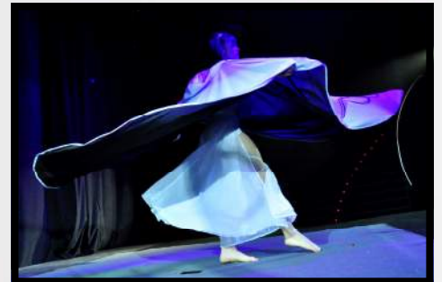
Odessa cape : Numéro en solo d'acrobatie et danse