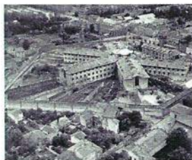
Vue an- née 50