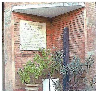
Lieu de Mémoire À l'intérieur du « Castelet »