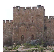
JESUS est la porte