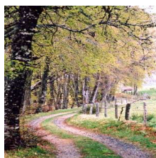
JESUS est le chemin