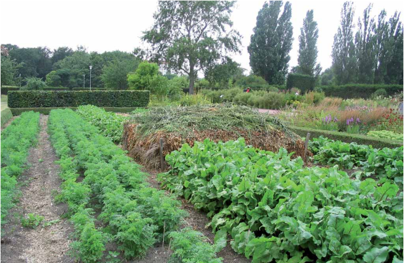
Jardin potager

Une cinquantaine d'année plus tard, Duhamel du Monceau (8), après avoir lui-même expérimenté, considère qu'il « faut abandonner ces pratiques comme tout à fait ridicules et opposées à la bonne physique qui est toujours soumise à l'expérience ».