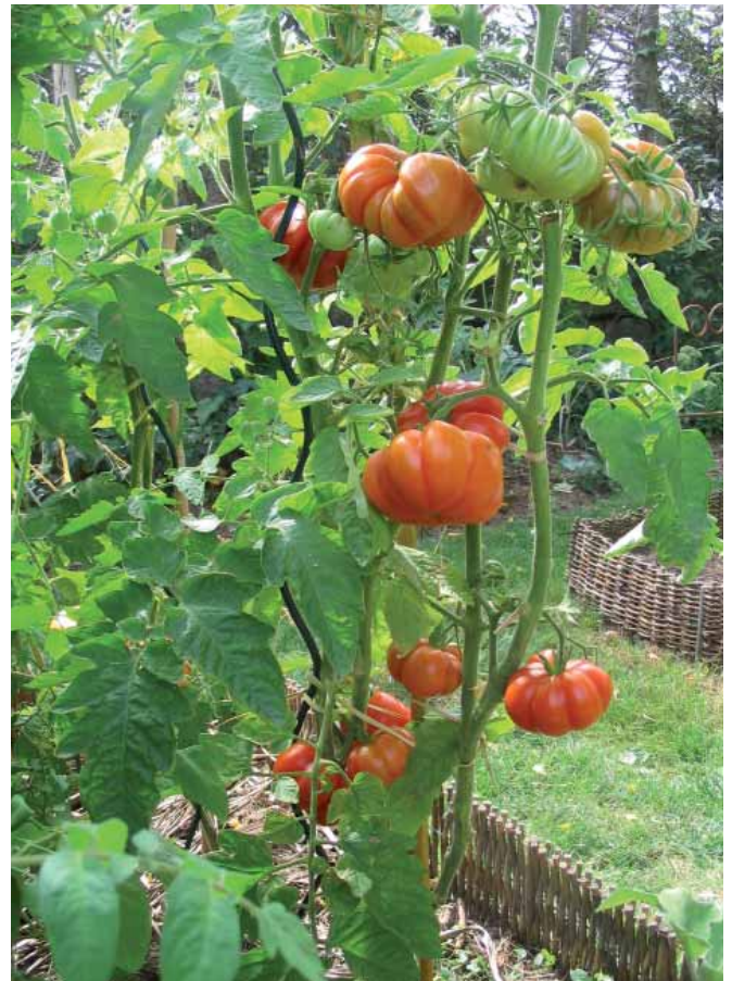
Pied de tomates