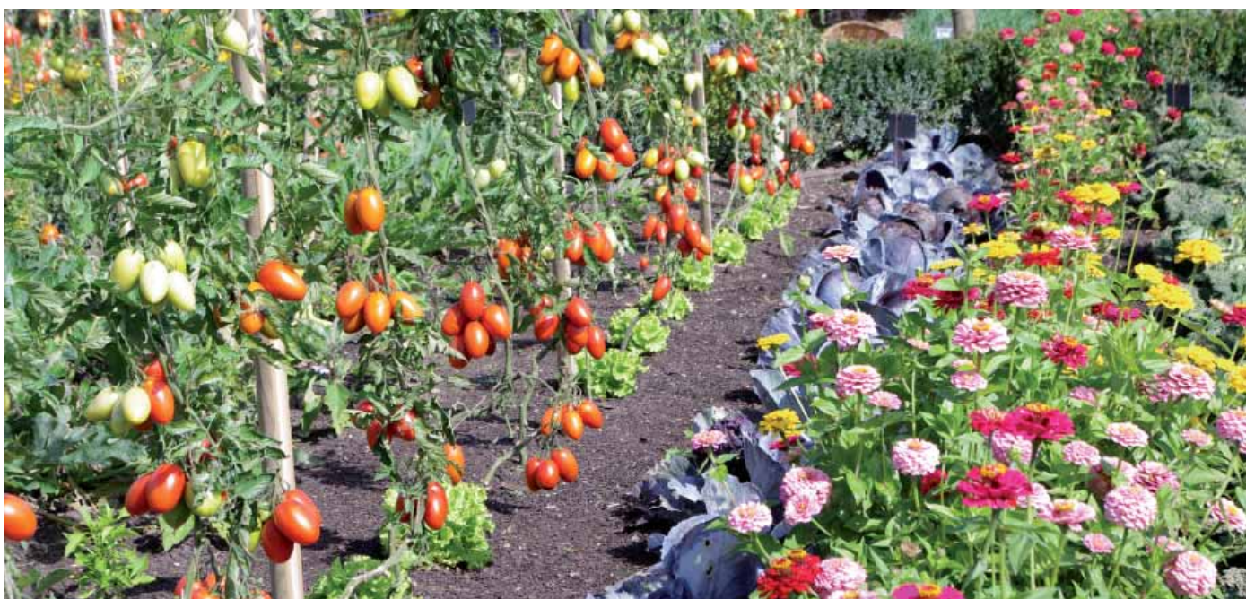
Jardin Terra botanica