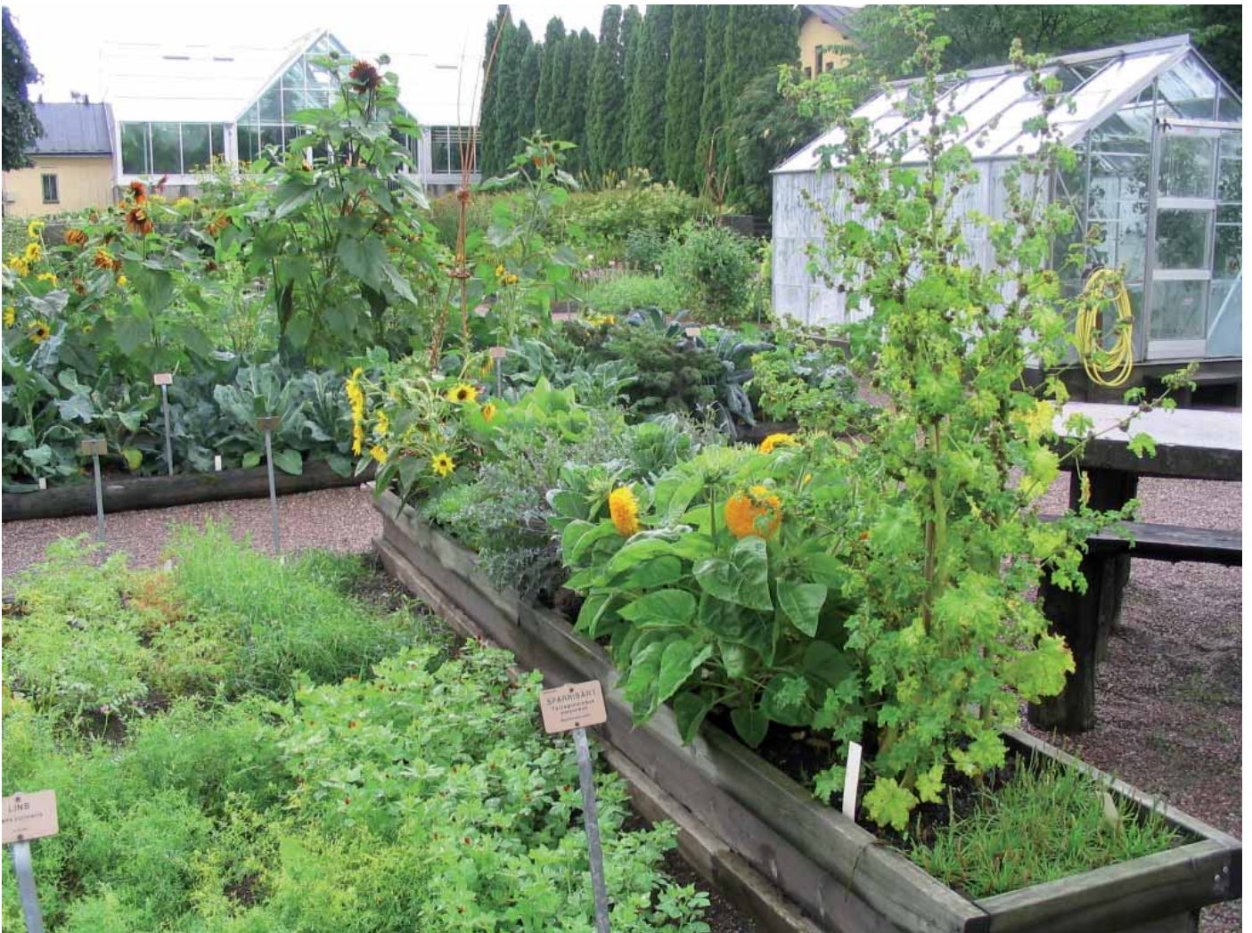
Jardin potager

ces documents préviennent le jardinier que s'il ne peut pas suivre le calendrier à un moment donné, il pourra toujours se rattraper plus tard.