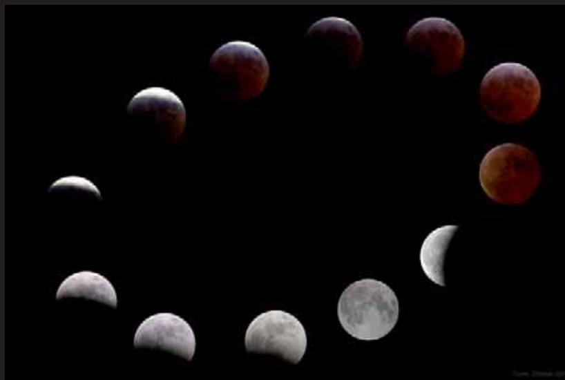
Phases de la lune - © Tizianoj

2) La révolution anomalistique fait référence à deux passages successifs de la lune au périégée de son orbite 3 autour de la terre. Sa durée est de 27j 13h 18min 35,1s. L'ellipse que parcourt la terre autour du soleil détermine le « plan de l'écliptique ». Ce plan est différent de celui formé par la trajectoire de la lune autour de la terre. On appelle nœud le moment où la trajectoire de la lune coupe le plan de l'écliptique. Quand la lune est au-dessus de ce plan elle est