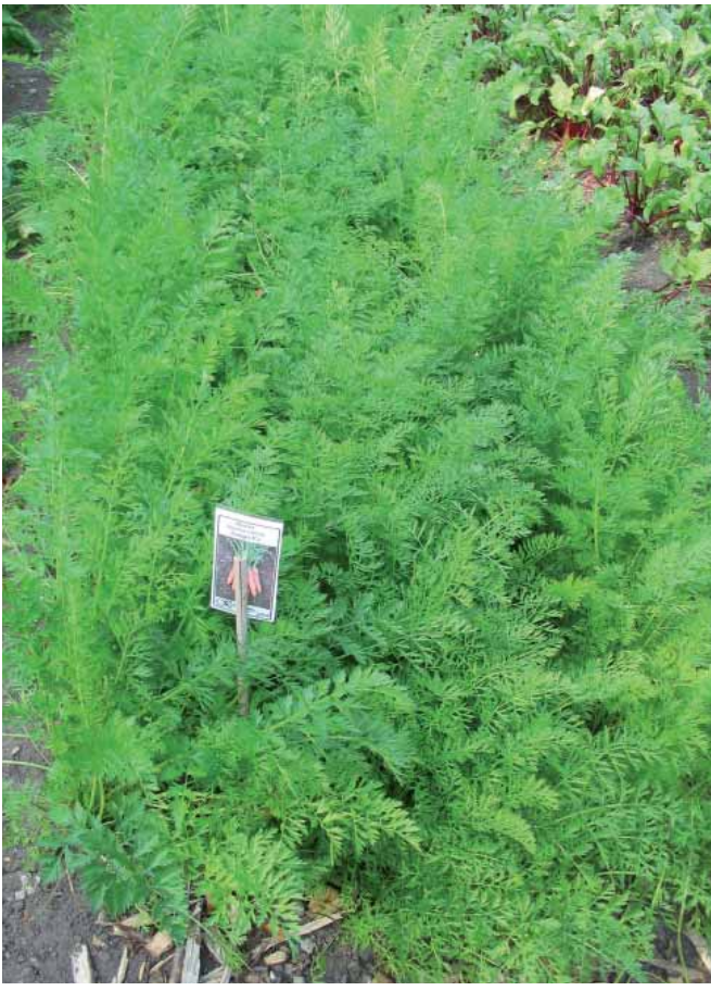
Rang de carottes

Très naturellement, ces recommandations ont été traduites dans des calendriers de jardinage dont un exemple figure déjà dans la Maison Rustique (4). Cependant, ces pratiques commencent à être mises en doute, à des degrés divers, par les agronomes du XVII e et XVIII e siècles. Olivier de Serre (6) s'interroge en remarquant que les traditions sont quelquefois contradictoires selon les régions : « les jardiniers d'Avignon et ceux de Nîmes quoique sous le même climat, ne sont pas d'accord sur tout : faisant heureusement les uns en une lune, ce que de même les autres font en une autre ». Il indique aussi que certains sont sceptiques et ne tiennent pas compte des traditions. Cependant, dans ses recommandations, il considère plus sage de se référer aux pratiques locales. La Quintinye (7), jardinier de Louis XIV, consacre un chapitre de son ouvrage aux effets de la lune sur les plantes horticoles. Ses conclusions sont sans appel. Après plus de 30 ans, il considère que tout ce qu'il a « appris par ses observations longues et fréquentes, exactes et sincères, a été que ces décours ne sont simplement que dires de jardiniers malhabiles ; ils ont cru par là, non seulement mettre à couvert leur ignorance à l'égard des points principaux du jardinage, mais en même temps ils ont espéré s'acquérir par ce jargon quelque croyance auprès des honnêtes gens, qui n'entendent rien à l'agriculture ».