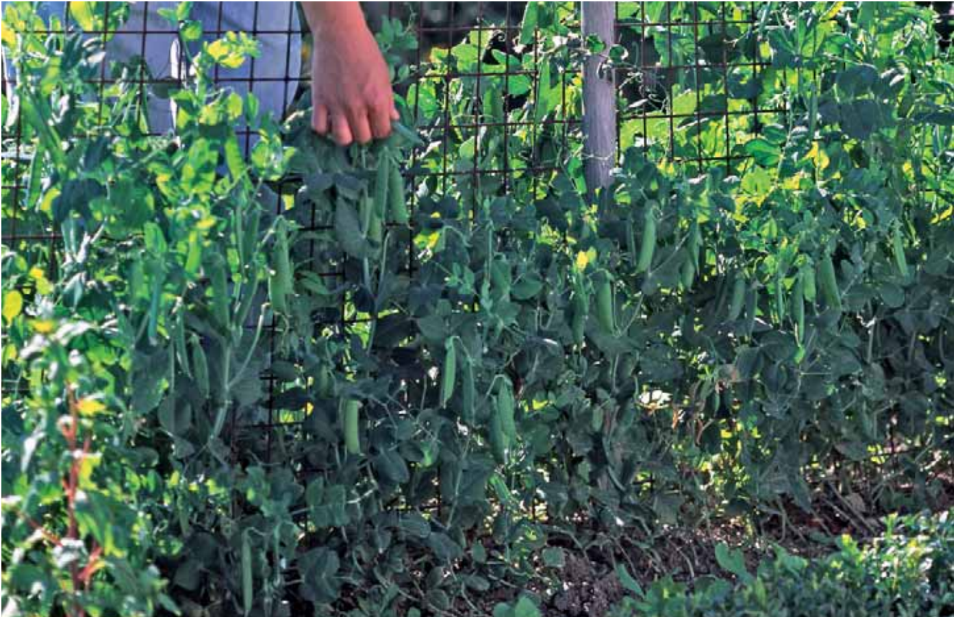
Récolte de pois - © F. Strauss / MAP