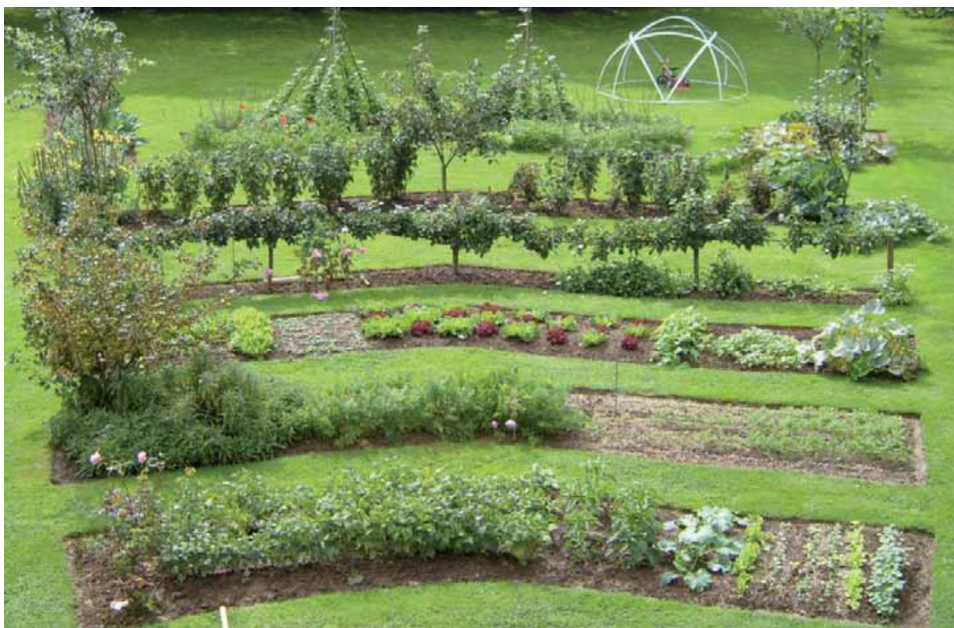
lauréat du Concours national des jardins potagers 2007

que soit la date de semis) si on les stratifie 6 au préalable, pratique simple et très courante pour les semences de végétaux ligneux. La stratification est donc un procédé plus sûr et plus performant qu'un semis en phase de pleine lune (PL). En 1992, Zürcher (15) expérimente sur les semences d'un végétal ligneux ( Maesopsis eminii ) sous climat africain stable. Il réalise 12 séries de semis deux jours avant la nouvelle lune (NL) et deux jours avant la pleine lune (PL). Pour lui, l'effet favorable d'un semis avant la pleine lune est évident. Cependant, aucune analyse statistique ne confirme cette affirmation. Quand on observe précisément la courbe de croissance des plantes, on remarque qu'elle est hétérogène d'un semis à l'autre et que plusieurs successions de résultats sont en contradiction avec les conclusions de l'auteur. Si on calcule à partir de la courbe, la taille moyenne des plantes, on trouve que les semis réalisés avant la pleine lune ont une hauteur moyenne de 11,9 \pm 2,1 cm et ceux réalisés avant la nouvelle lune, une hauteur moyenne de 9,7 \pm 4 cm. Les moyennes sont quasiment incluses dans le même intervalle de confiance. Elles ne sont donc pas statistiquement différentes. L'effet positif de la pleine lune, mentionné par Zürcher ne peut donc pas être prouvé.