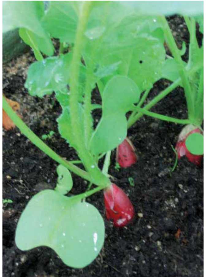
Radis