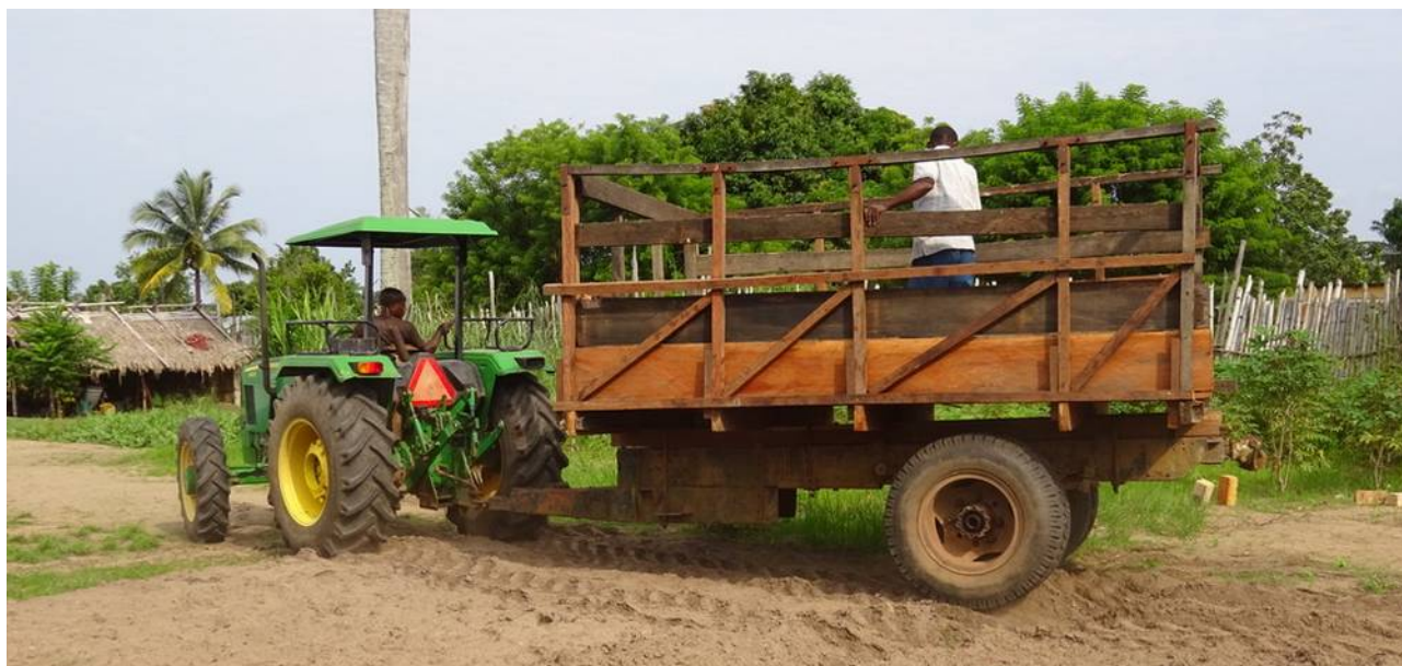
Le tracteur et sa remorque réparée sur la concession de Bumba

comme neuve qui est tractée et qui pourra participer à l'extension des projets agricoles de l'ONG sur sa concession de 135 hectares à Yambenga.