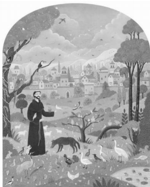
François d'Assise par Alain Thomas

Alors qu'un certain nombre de personnes du quartier des Balances sont encore assoupies – nous sommes le dimanche matin, 7 octobre, à 9h30, dans un parloir –, douze volontaires s'engagent dans une réflexion sur l'avenir de la paroisse Saint-Paul, une communauté bien modeste par rapport à sa voisine... ; en quelque sorte, si on entre dans le monde des oiseaux... un colibri !