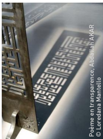
Poème en transparence, Abdallah AKAR

REGARDS D'ARTISTES CONTEMPORAINS SUR LA CULTURE AFRICAINE