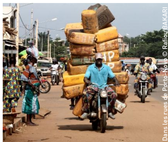
Dans les rues de Porto-Novo

Abdallah AKAR est un artiste calligraphe dont les œuvres sont exposées à travers le monde. En recherche permanente de nouveaux supports, ses calligraphies se déploient sur le bois, le textile et le métal, révélant la noblesse de la matière à travers la finesse des écritures.