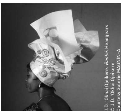
J.D. 'Okhai Ojeikere. Bank. Headgears © J.D. 'Okhai Ojeikere Courtesy Galerie MAGNIN-A