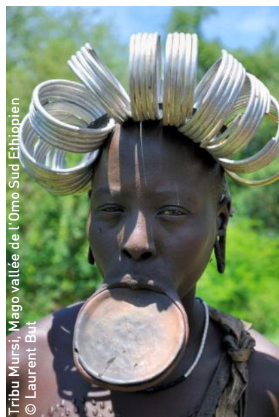
Tribu Mursi, Mago vallée de l'Omo Sud Ethiopien