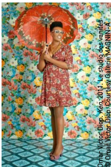
Omar Victor Diop. Ken, 2011. Le studio des vanités © Omar Victor Diop. Courtesy Galerie MAGNIN-A