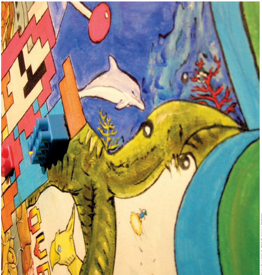
Game Over l'été, 2013 © Jérôme ANZIANI