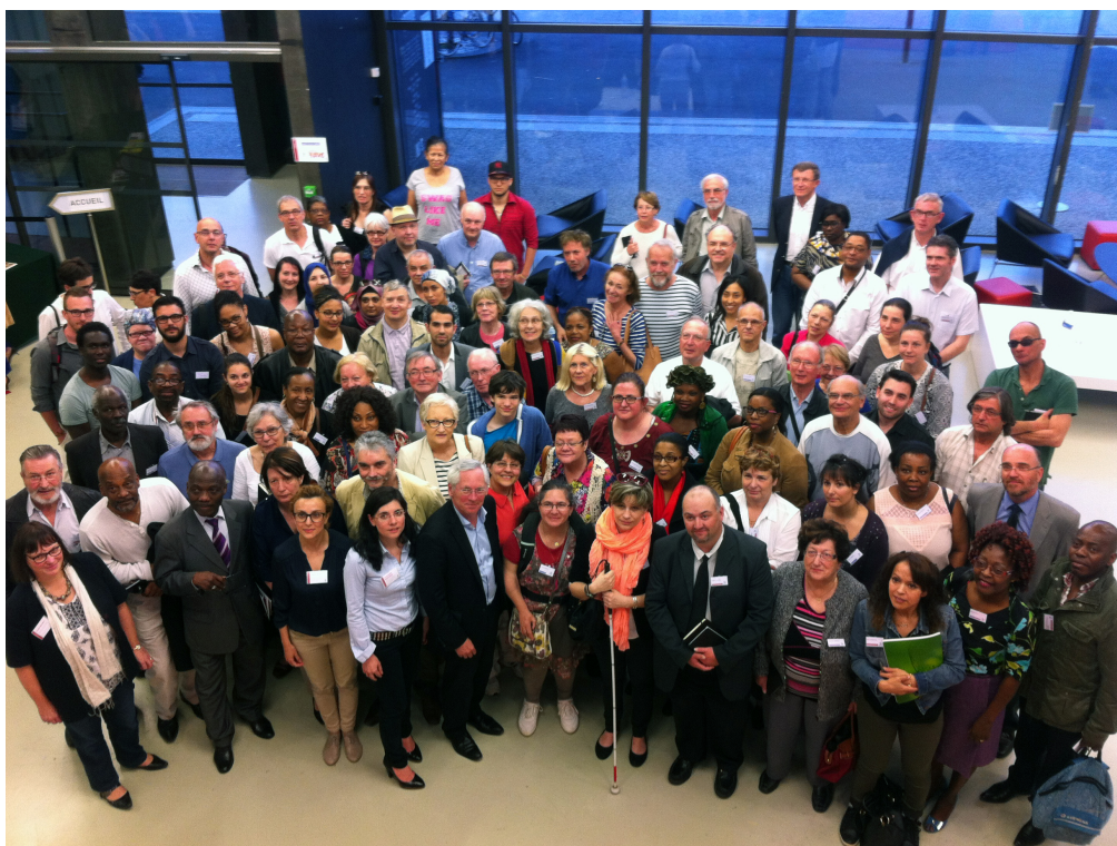
Photo de groupe des CIL lors de la réunion de lancement – Visages du Monde, le 15 avril 2015