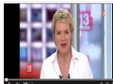
KOEZIO AU JT de France 2