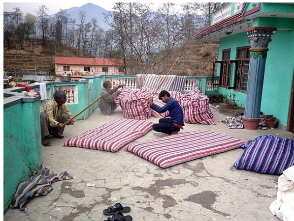
La finition des matelas