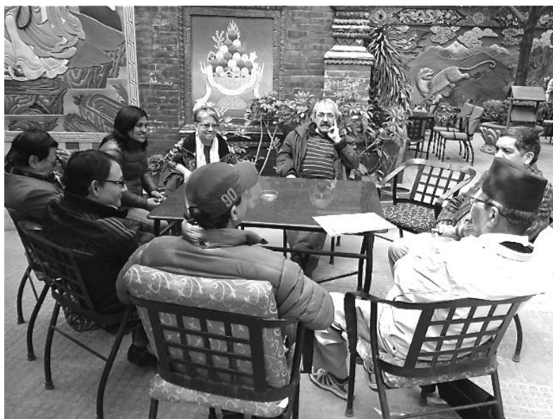
Rencontre avec l'AWAC... qui met la main à la poche

J'ai à nouveau expliqué son fonctionnement, la répartition des filles et garçons ainsi que l'affectation des pièces dans les étages de chaque aile.