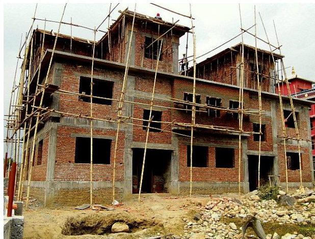
Façade de la Maison : le gros-œuvre est fini !