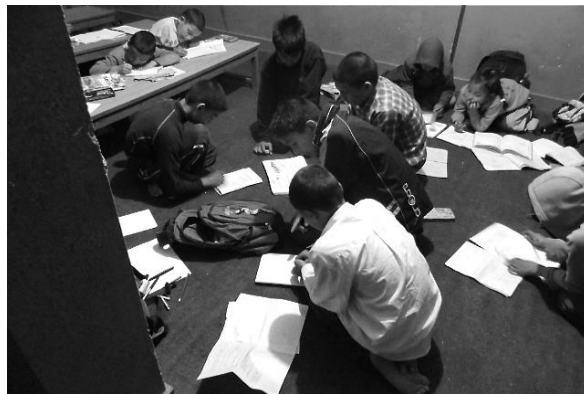
Sur un bureau ou par terre, on travaille

La nuit fut courte, les chiens ont aboyé jusqu'à minuit passé et la température était plutôt fraîche, difficile dans ces conditions de trouver le sommeil.