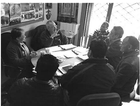
Chez l'architecte : derniers détails