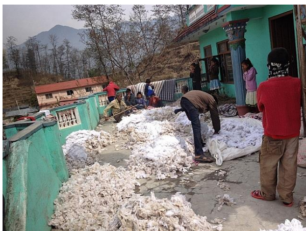
La livraison du rembourrage

C'est le printemps, le bon moment pour une réfection des matelas.